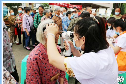
图①:筑牢疫情防控安全屏障,全天24小时开展核酸检测工作。 图②:检验科奋战在抗疫一线,核酸检测目标本量达1.1万余管。 图③:不断开拓创新,引进新技术、新疗法,为患者精准治疗护航。 图④:引进多位专家,有效提升医院疾病综合诊治水平。 图⑤:积极投身慈善公益事业,常年开展免费体检和义诊活动等公益活动。