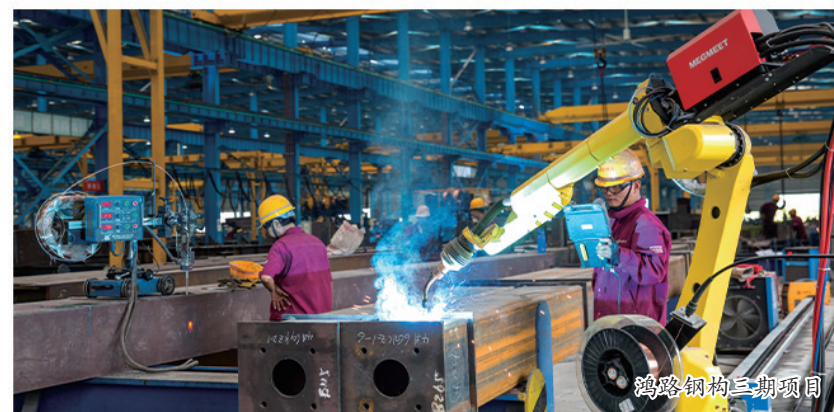
鸿路钢构三期项目