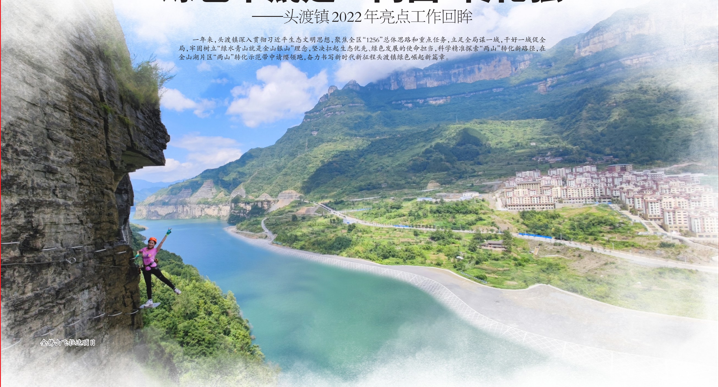
金佛山飞拉达项目

一年来，头渡镇深入贯彻习近平生态文明思想，聚焦全区“1256”总体思路和重点任务，立足全局谋一域，干好一域促全局，牢固树立“绿水青山就是金山银山”理念，坚决扛起生态优先、绿色发展的使命担当，科学精准探索“两山”转化新路径，在金山湖片区“两山”转化示范带中请缨领跑，奋力书写新时代新征程头渡镇绿色崛起新篇章。