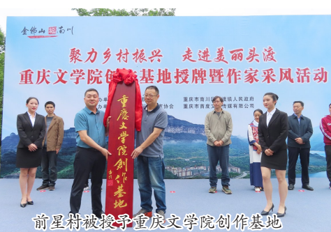
前星村被授与重庆文学院创作基地