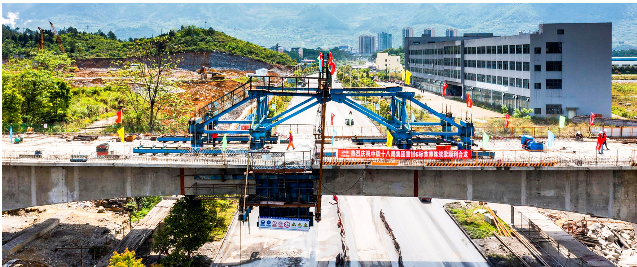
渝湘高铁重庆至黔江段站前6标水江大道双线特大桥梁连续梁顺利合龙现场

2022年是渝湘高铁建设关键之年，区铁路建设指挥部在区委、区政府的坚强领导下，紧紧围绕自身工作职能和既定工作目标，砥砺奋进、攻坚克难，圆满完成各项工作任务。