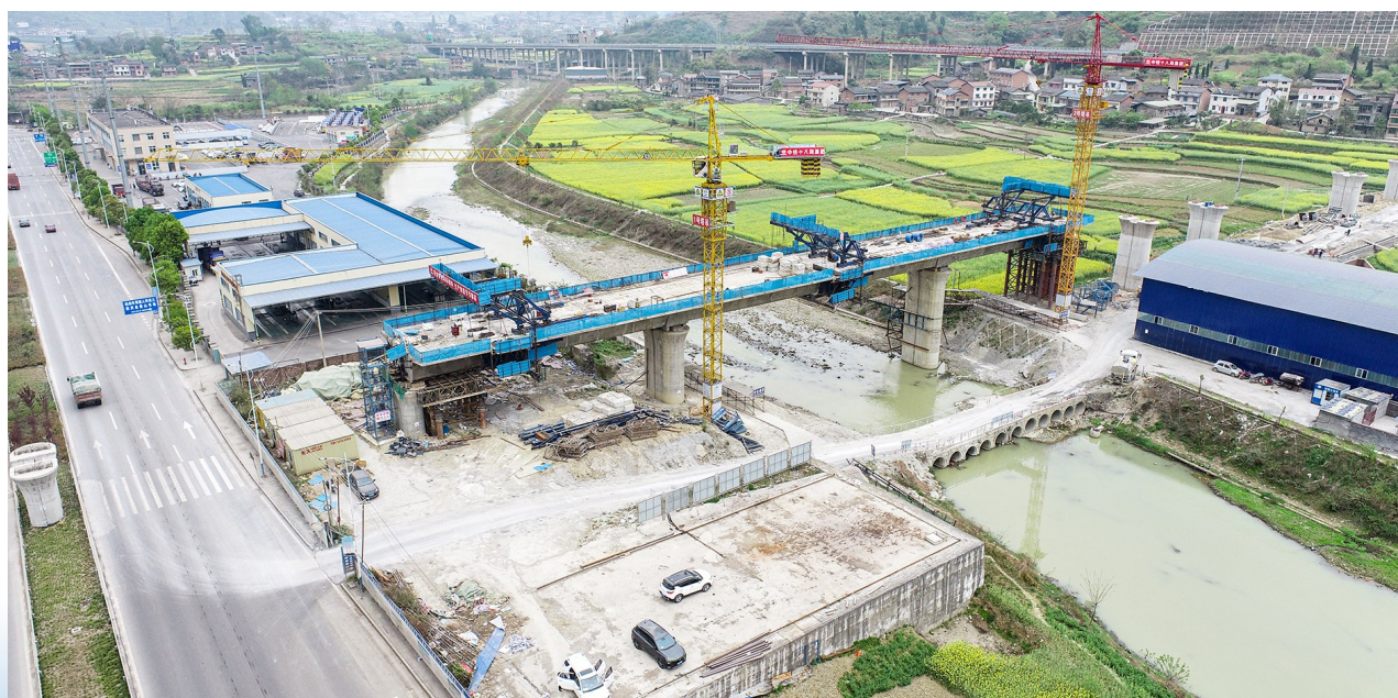
渝湘高铁南川北站引出桥全线桥墩架设现场