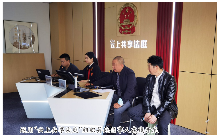
运用“云上共享法庭”组织异地当事人在线开庭

2022年，区法院坚持以习近平新时代中国特色社会主义思想为指导，深学笃用习近平法治思想，紧紧围绕“努力让人民群众在每一个司法案件中感受到公平正义”的目标，坚持服务大局、司法为民、公正司法，忠实履行宪法和法律赋予的职责，各项工作取得新成效。