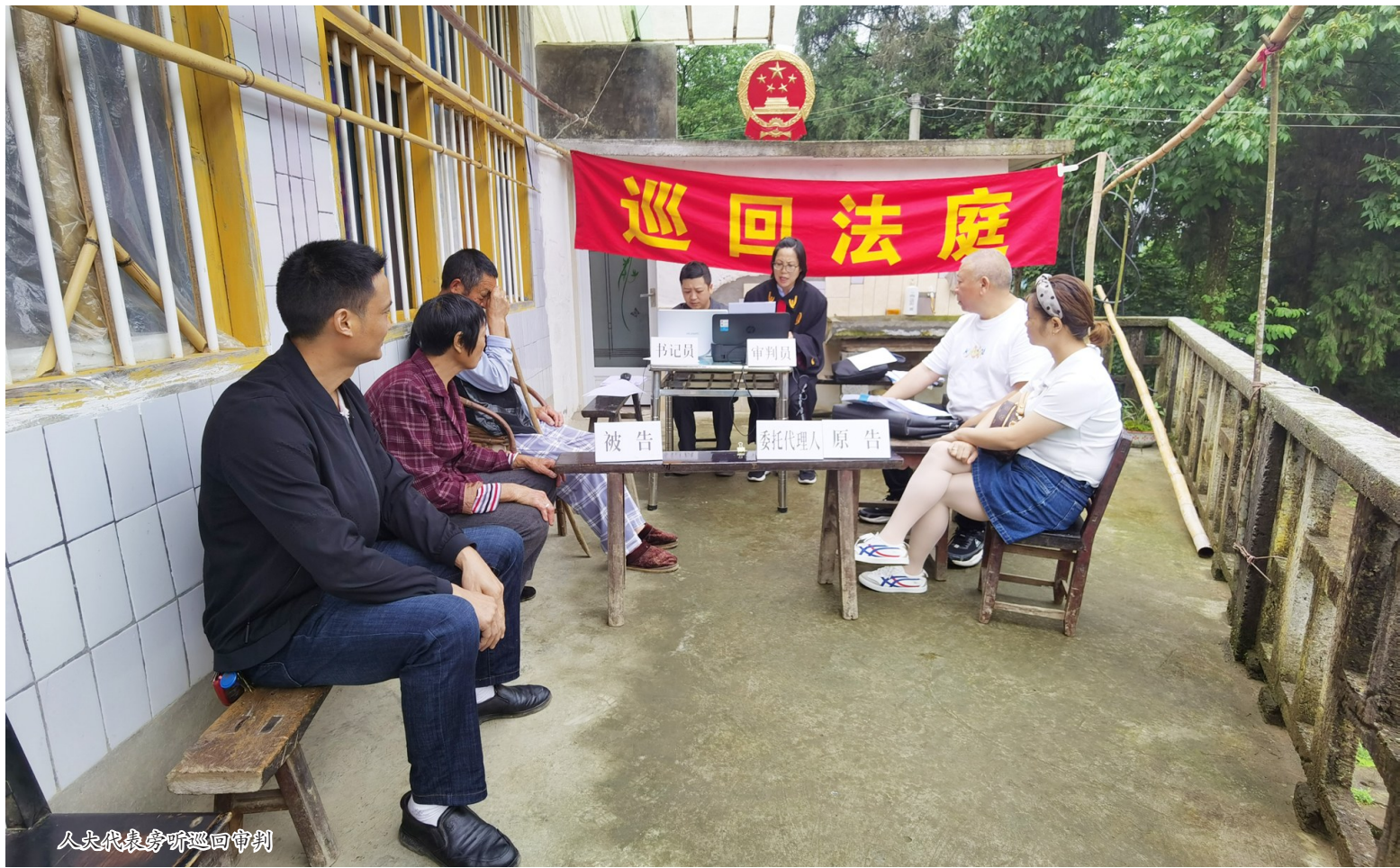
人大代表旁听巡回审判