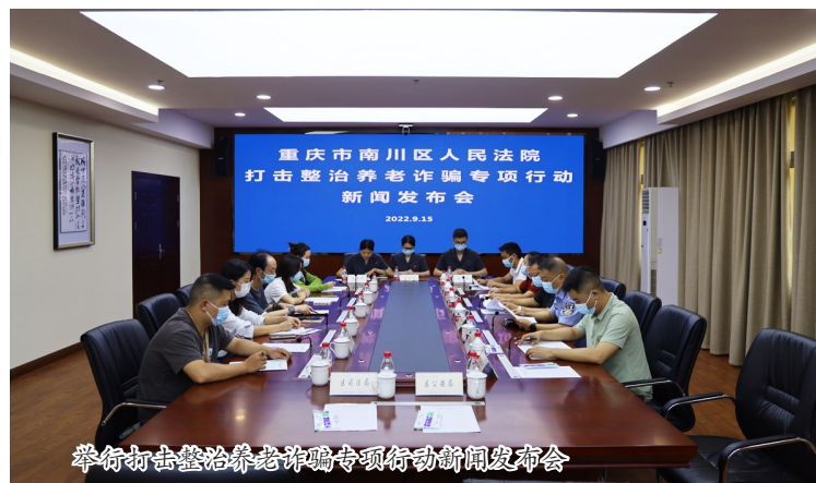
举行打击整治养老诈骗专项行动新闻发布会