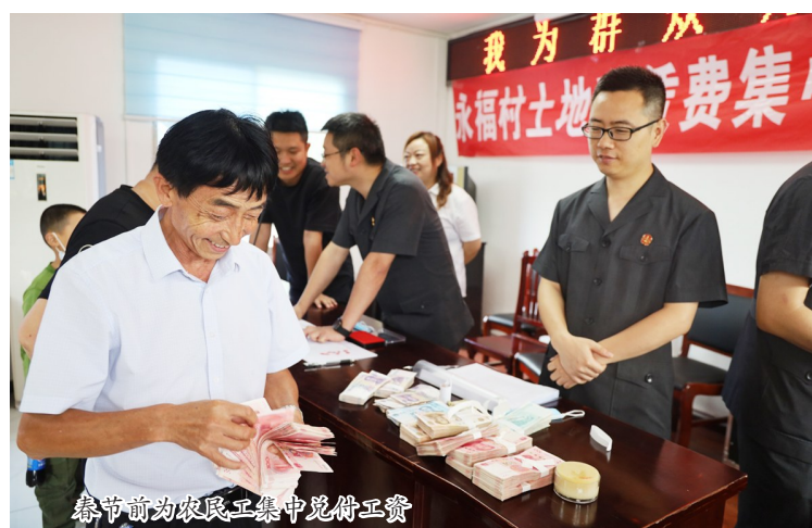
春节前为农民工集中兑付工资