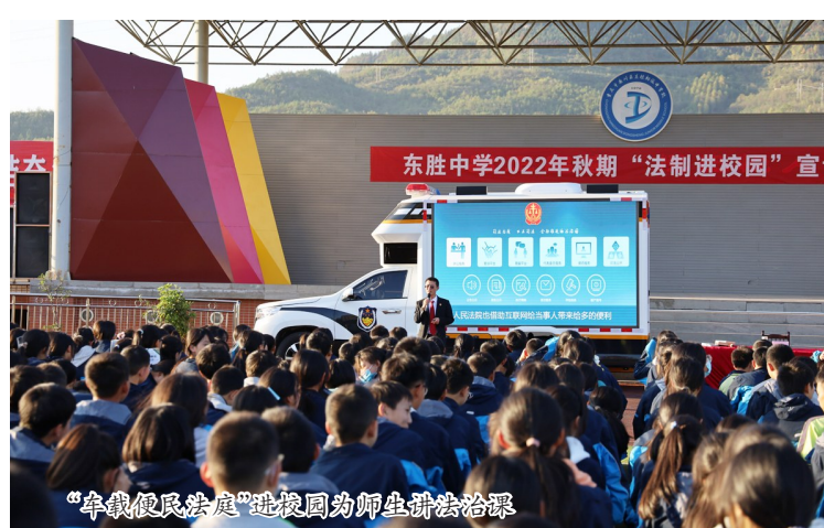
“车载便民法庭”进校园为师生普法治深