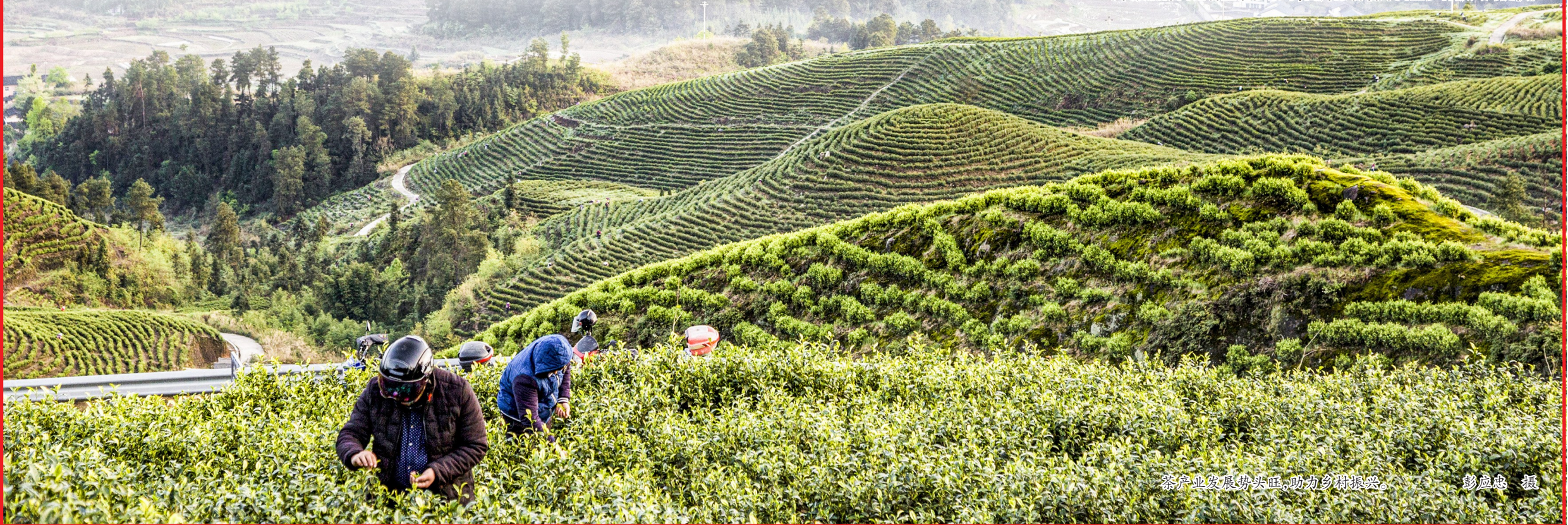
茶产业发展势头旺，助力乡村振兴。