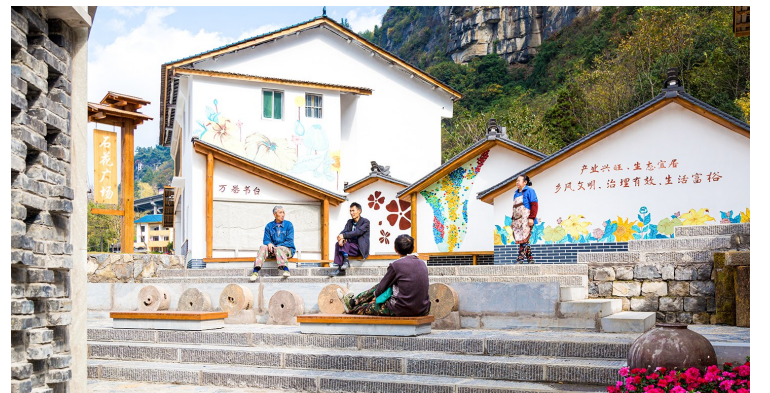
三泉镇在羊河社区打造美丽乡村示范点石花广场，不断改善农村人居环境。

同时，采取“派、请、找、引、选”等方式，推动152名干部、专家能人精准实施驻村帮扶；落实驻村工作队经费120万元，完成驻村工作队人员培训全覆盖，严格执行“三在村”工作要求，切实发挥各驻乡驻村工作队引领作用。