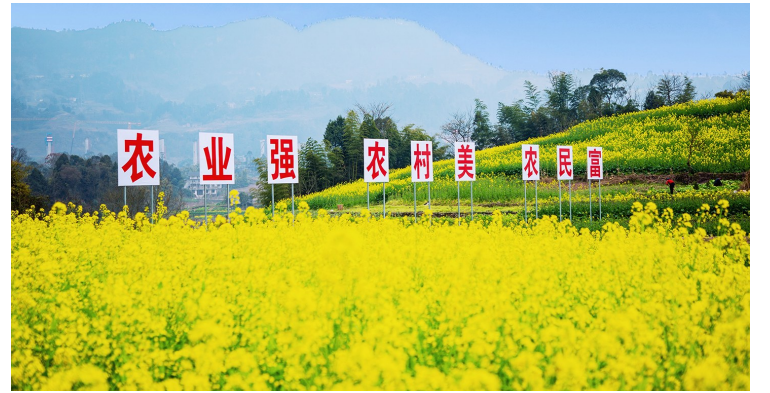
鸣玉镇建设向家沟乡村振兴示范长廊，以艺术赋能乡村，强力助推乡村振兴。

同时，我区还扎实开展“大走访大排查大整改”行动，实现“三保障”及饮水安全保障问题动态清零。对国家、市级考核评估等发现问题反馈各类问题及整改措施进行综合研判，明确问题清单、任务清单、责任清单，实行签字“背书”制度，切实推动国家、市级考核反馈的问题以及“三大行动”发现的问题全部完成整改，为巩固脱贫攻坚成果进一步补短强弱。