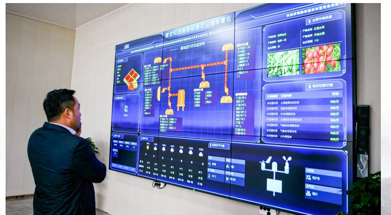
我区大力推广智慧农业，利用信息化技术，助推乡村振兴。

区乡村振兴局相关负责人表示，将继续弘扬脱贫攻坚精神，坚持把巩固拓展脱贫攻坚成果作为全面推进乡村振兴的底线任务，持续完善和严格落实防止返贫监测和帮扶机制，多措并举拓宽农民增收致富渠道，组织实施乡村建设行动，不断完善乡村治理体系，扎实有序建设宜居宜业和美乡村。