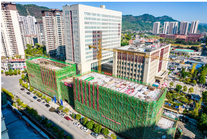
区中医医院感染性疾病综合楼项目已完成主体封顶。

实施文体惠民项目,向市民免费开放文化馆、图书馆、体育场馆,基层公共文化服务中心等设施,升级公共文化阵地,举行全民艺术普及公益讲座、展演、展示、培训等文化活动;放映公益惠民电影2800场,送演出、展览、讲座、培训辅导等进村220场次;开展区级赛事活动20场次。在医疗养老方面,实施医疗基础设施提升工程,持续推进区疾控中心、中医医院感染性疾病综合楼建设。启动长亭、龚家塘等一批养老服务设施项目。在促进就业方面,城镇新增