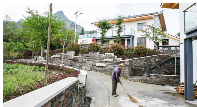
干净整洁的山王坪镇龙泉村。