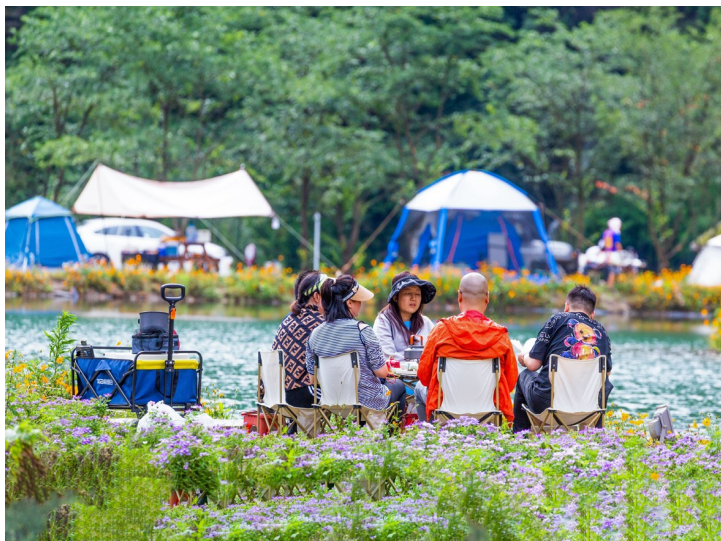
游客在万卷书台花海露营地休闲、小憩。