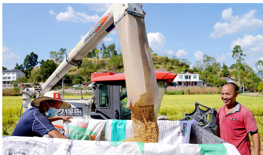
村民收获优质水稻。