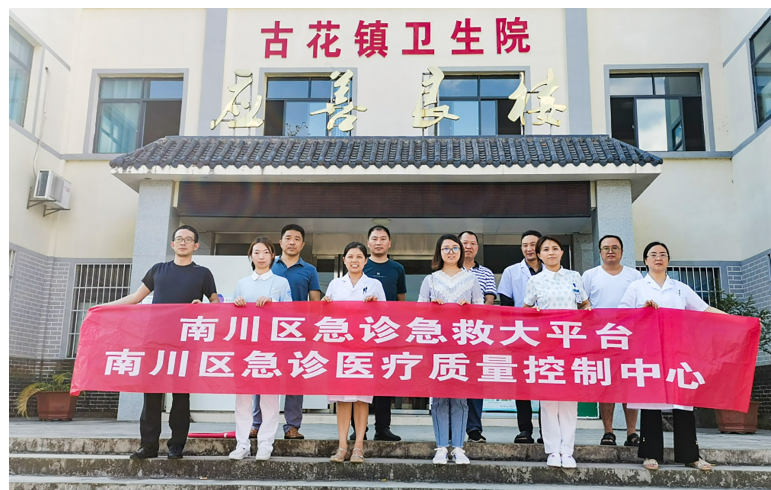
急诊科到乡镇卫生院开展急救技能培训。

区人民医院急诊科党支部共有14位党员，虽然同处一个科室，但有着不同的分工——医生、护士、救护车司机，相同的使命——争分夺秒、救死扶伤，他们和同事一起串联起了病人的救护链，默契合作，高效运转，帮助病人转危为安。