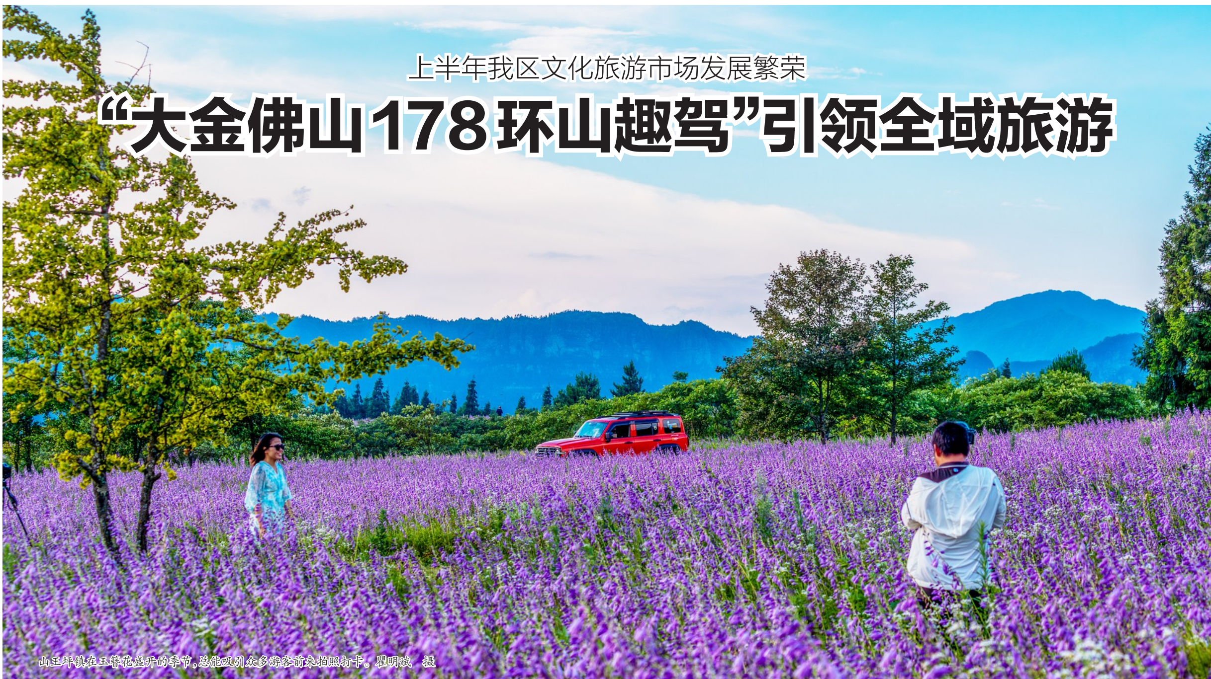
山王坪镇在玉簪花盛开的季节,总能吸引众多游客前来拍照打卡。

盛夏时分,树木苍翠。南川有山间清爽的风,有东街温柔的光,有乡间丰收的香,游客纷至沓来,文化旅游市场尤其繁荣。据区文化旅游委数据,今年1月~6月,全区共接待游客1903万人次,实现旅游综合收入119.82亿元,同比分别增长8.2%、14.9%。“五一”期间,全区接待游客量、旅游综合收入在全市11个有5A级景区的区县中名列第一。