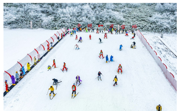
在冬季开展滑雪、戏雪等活动,将特色优势转变成发展优势。