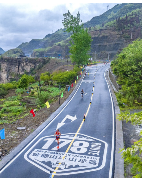
举办金山半程马拉松,让参赛选手尽享在“大金佛山178环山趣驾”沿线奔跑的独特魅力