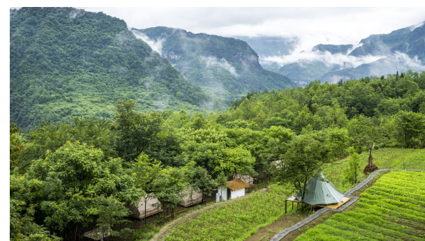
德隆镇借势赋能打造喜见山居民宿,让游客能够在此看山观云,陶冶情操。

目前,我区正在加快完善“大金佛山178环山趣驾”环线的标识导览系统,加快完善沿线自驾旅游服务站点,加快打造百家精品民宿和精致露营地,完善环山趣驾服务保障等,全面提升文化旅游市场环境,繁荣文化旅游市场,推进文化旅游消费升级,宣传、打造具有南川辨识度的“大金佛山178环山趣驾”文旅品牌。