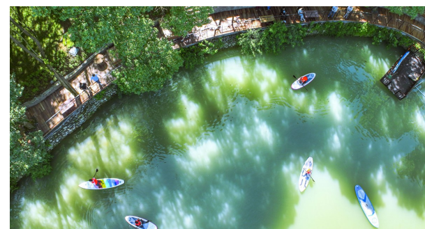
游客在栖乐谷亲子度假乐园享受夏日清凉。

近年来,我区依托山水自然、乡村田园特色优势,把文旅融合作为乡村振兴的有效路径,及时跟进出台露营、民宿、冰雪三大产业专项规划,努力将乡村特色资源优势转化为产品优势、市场优势、品牌优势。