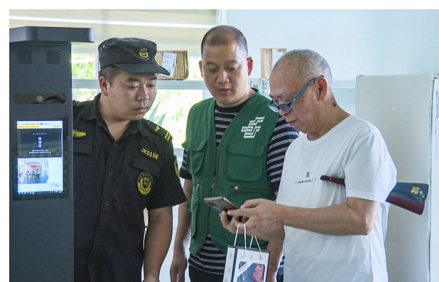
在快递站取包裹。

本报讯(记者 聂灵灵)“杨先生你好,你的快递到了,请你到快递站来领取一下。”近日,在水江镇长青森林康养度假区,快递员正在将居民的包裹一一核对入库,并通知业主前来领取。