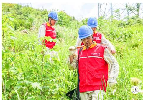
图①:巡检人员用无人机进行红外测温。 图②:闷热的天气让巡检人员一口气喝完一瓶水。 图③:巡检人员穿梭在山林之中。