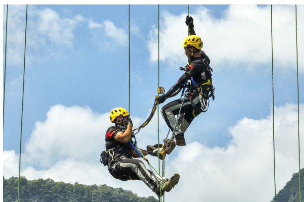
参赛队员相互配合向上攀登。