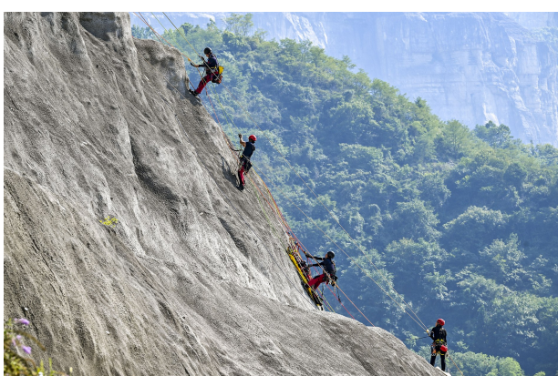
参赛队员在进行野外救援项目比拼。