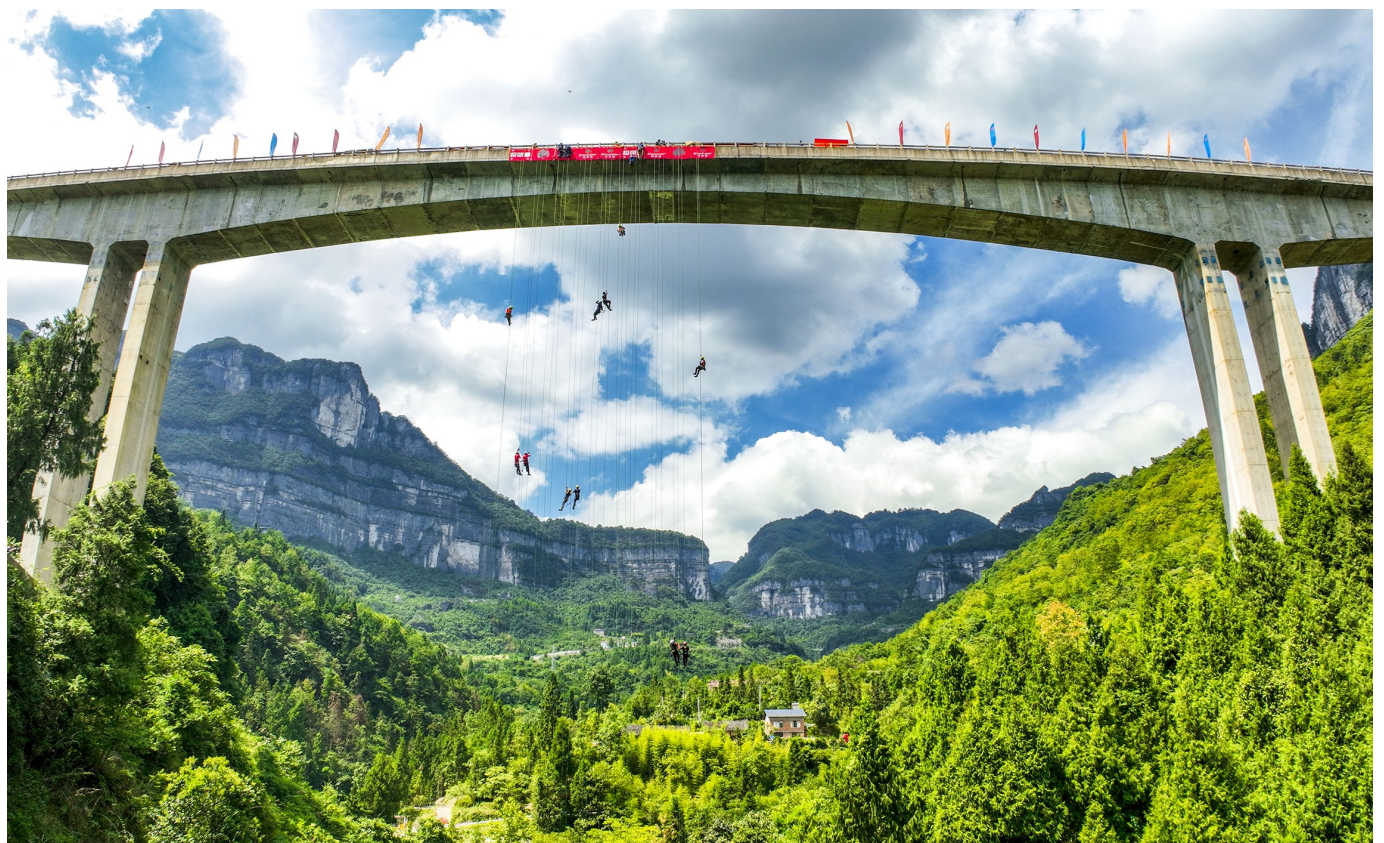
参赛队员在进行个人技能赛「百米上攀」技能比拼。