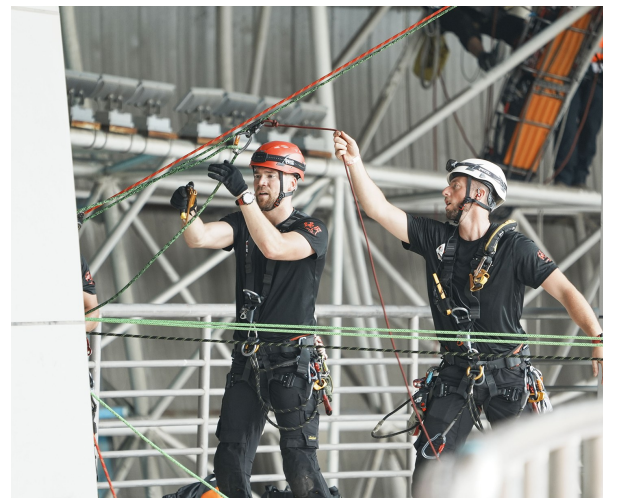
参赛队员在调整绳索松紧度和位置。