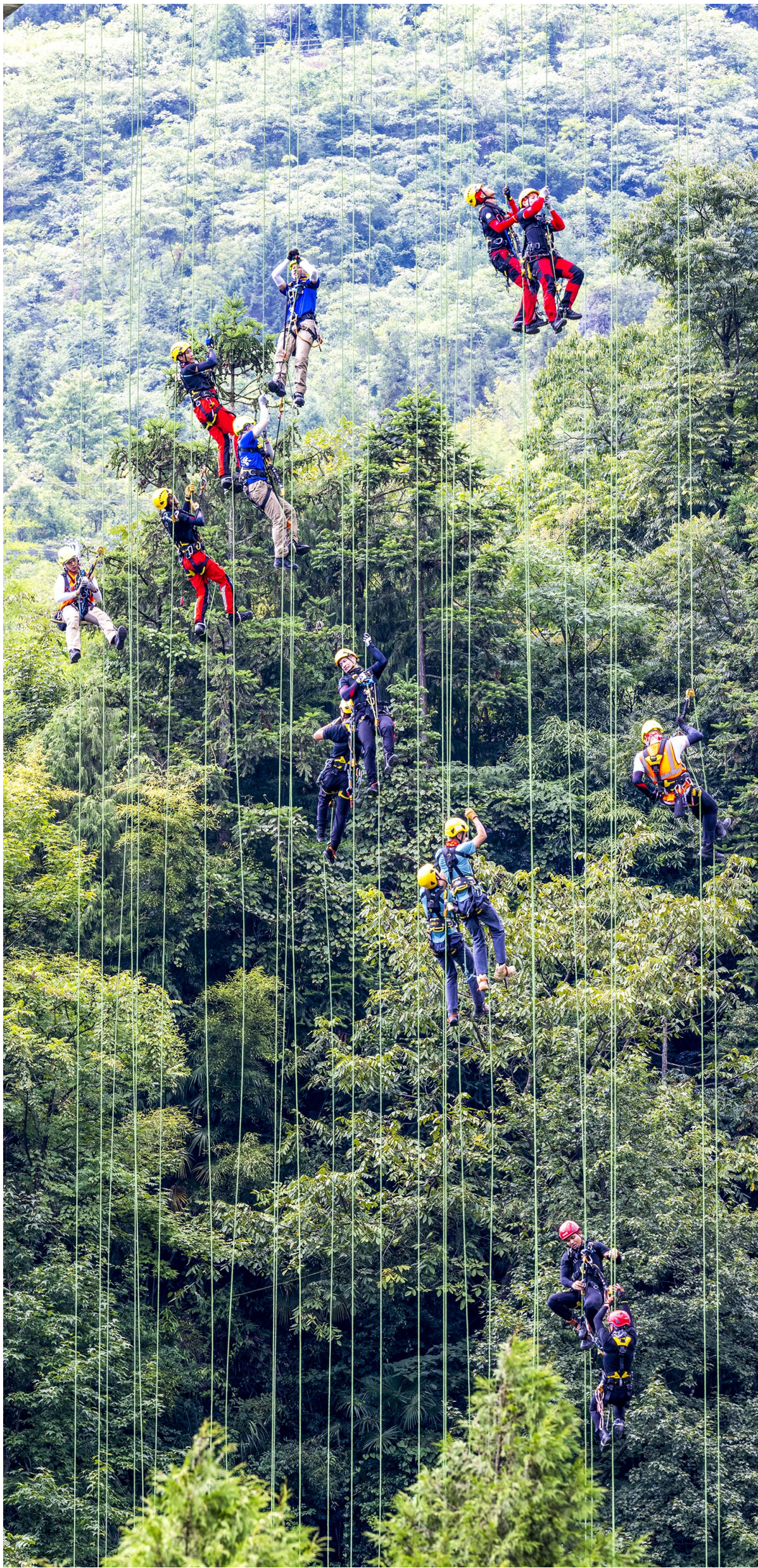
参赛队员犹如“蜘蛛侠”在空中展现速度与力量。