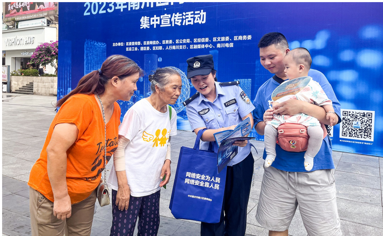
民警向市民讲解网络诈骗知识。

活动当天，市民在“文明上网 从我做起”的签名墙上签名，承诺在生活中文明上网。区委网信办也发出倡议，倡导广大市民严守传播秩序、完善造谣格局、辟除网络谣言、共建网络文明，协力筑牢抵制网络谣言传播的坚固长城，共同培育积极健康、向上向善的网络文化，形成全社会共同抵制、共同治理网络谣言的良好局面。