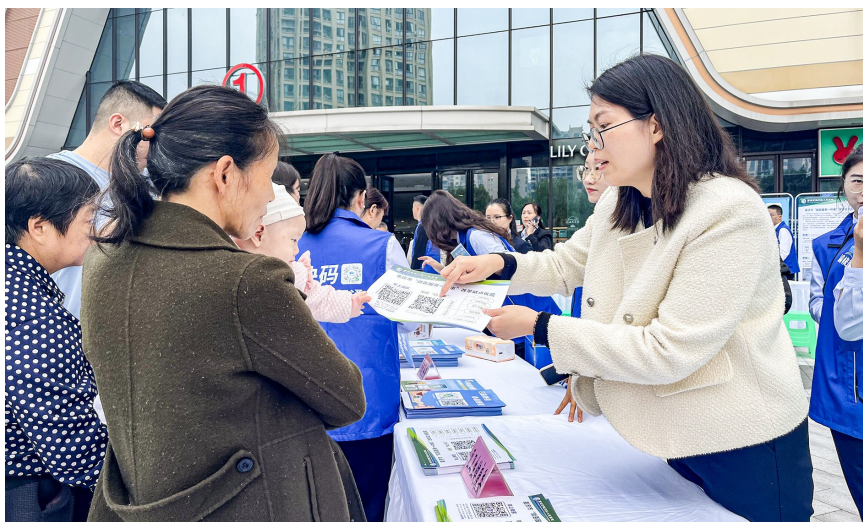
工作人员面对面向市民讲解政务服务便民政策。

本报讯(记者 聂灵灵)11月4日,我区在万达广场举行政务服务集中宣传推广活动,面对面向市民讲解政务服务便民政策。