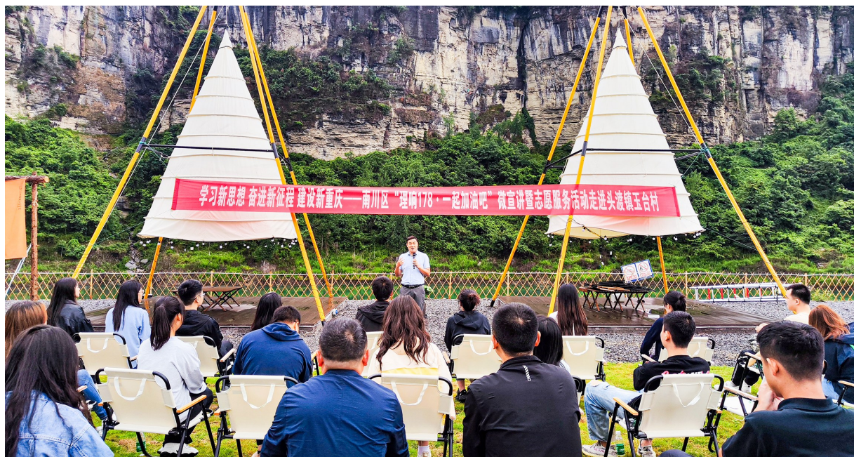
在头渡镇开展的“理响178·一起加油吧”微宣讲活动中,志愿者向村民倡导文明旅游新风尚。