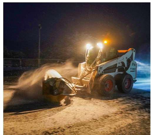
▲除雪车对景区积雪进行清扫,确保游客出行安全。