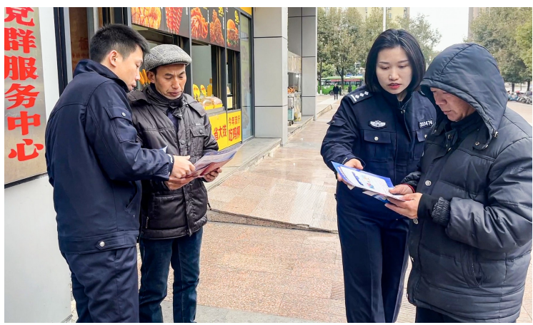
民警开展反诈宣传。