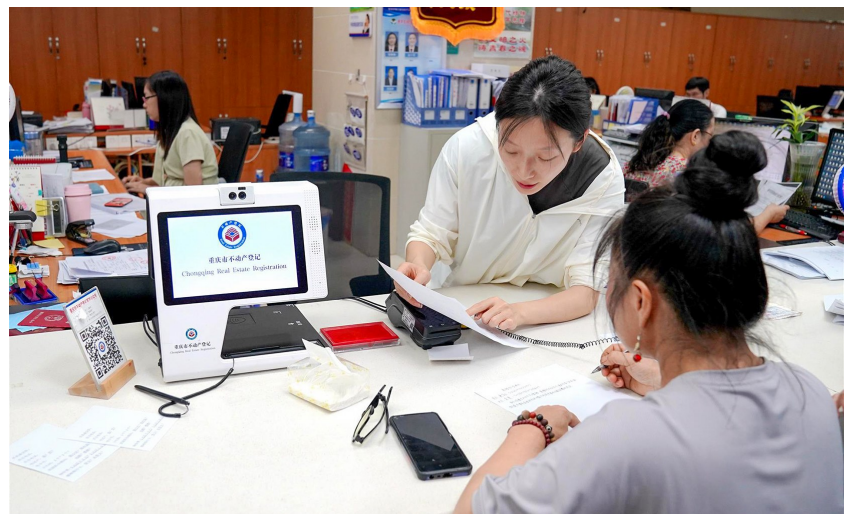
实施“互联网+不动产登记”,不断提高办事效率。

提升规划服务,优化营商环境。持续提升“放管服”改革,开展行政审批标准化建设,加快基层规划自然资源所标准化建设,推进“服务窗口前移”“执法