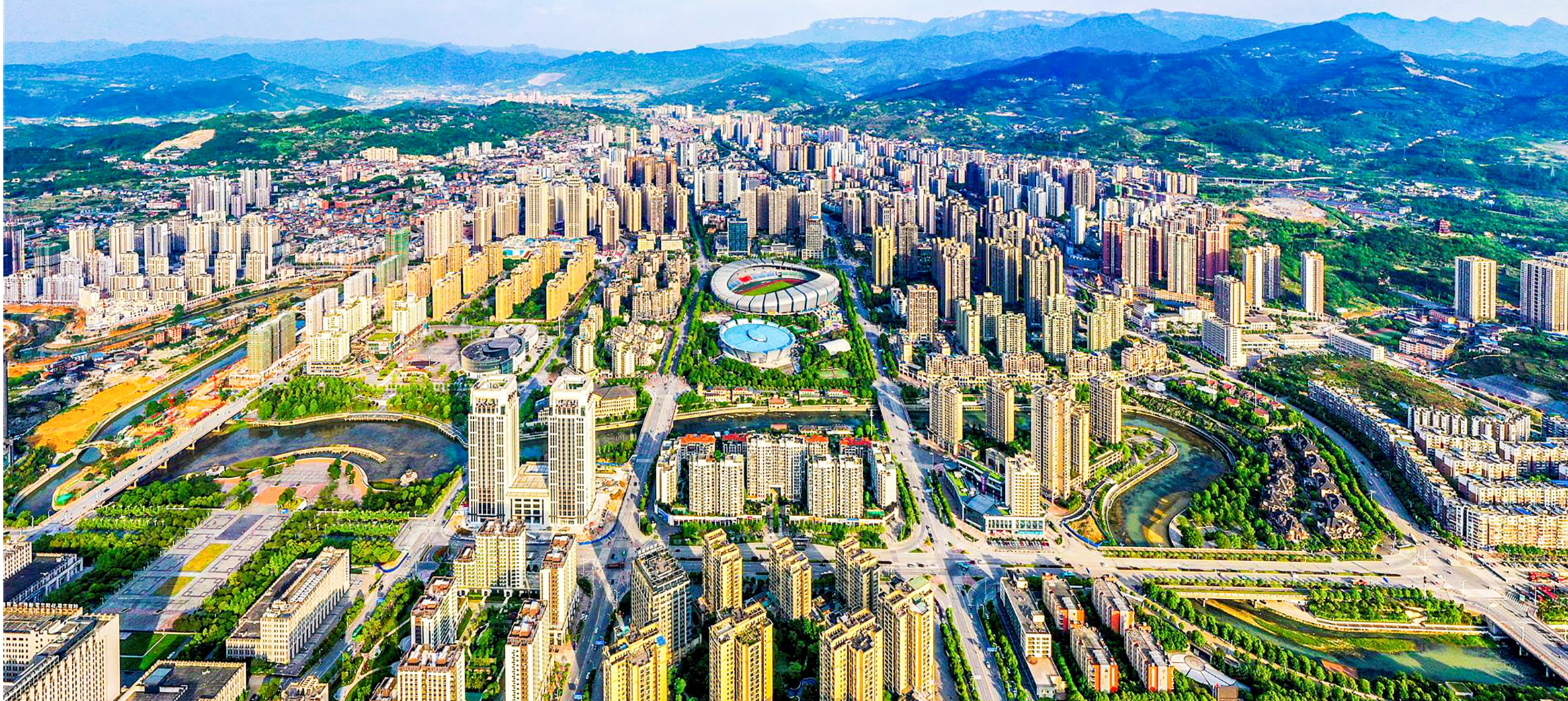
日新月异的南川城区

2023年,区规划自然资源局切实发挥国土空间规划统筹引领作用,着力在我区耕地保护、自然资源调查监测、节约集约利用、生态安全方面下功夫,努力以更高水平国土空间规划和自然资源要素保障助推全区经济社会高质量发展。