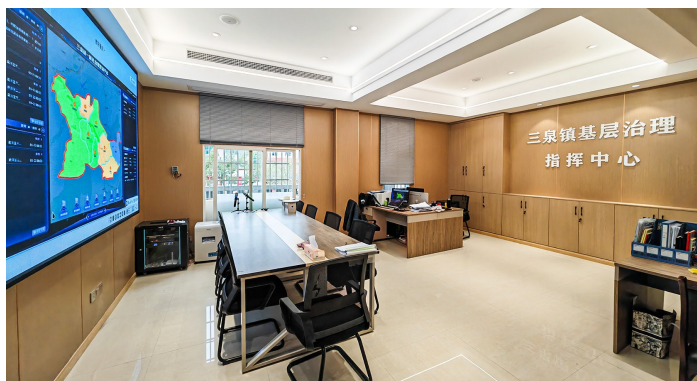
基层治理指挥中心。