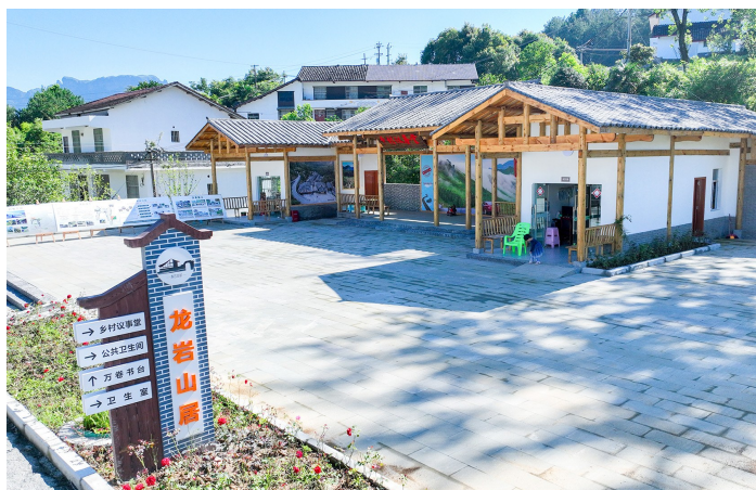
龙岩山居乡村议事堂。

全年镇财政税收1182万元,较去年增长23.7%;区级留成税收任务480万元,较去年同期增长20.2%;限上住宿餐饮业营业额9544.7万元,固定资产投资3.39亿元(按500万元以上投资额统计),农村居民人均可支配收入进入2.39万元。