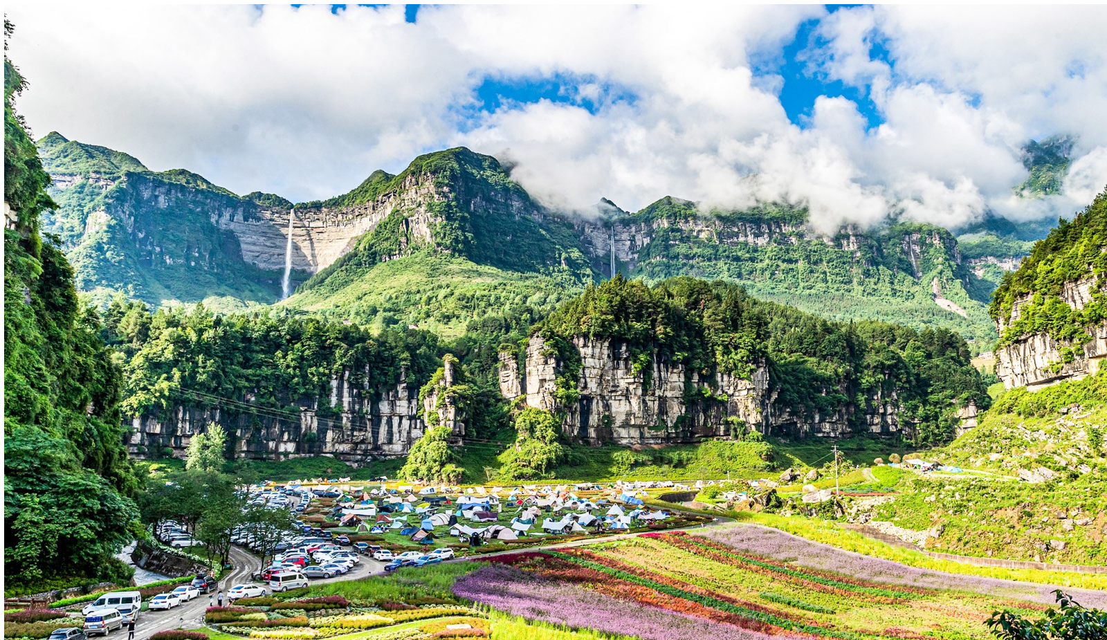
万卷书台景区露营地。