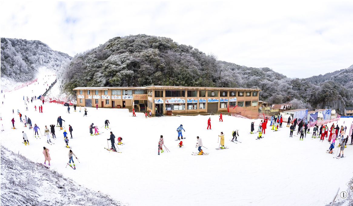
图①:金佛山北坡滑雪场 图②:天星温泉小镇 图③:南川东街

时间: 2月10日~17日(正月初一至初八)9:00~16:00 地点: 古佛洞 内容: 在古佛洞外设置祈福签点位,游客可定制如“平安顺遂”“事业有成”“姻缘美满”等内容的新年祈愿,并加盖金佛山印章,放置于手机壳中。