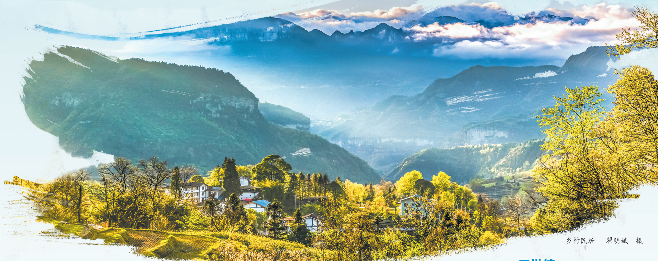
乡村民居