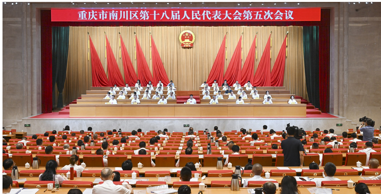
7月30日,在圆满完成大会各项议程后,区十八届人大五次会议闭幕。