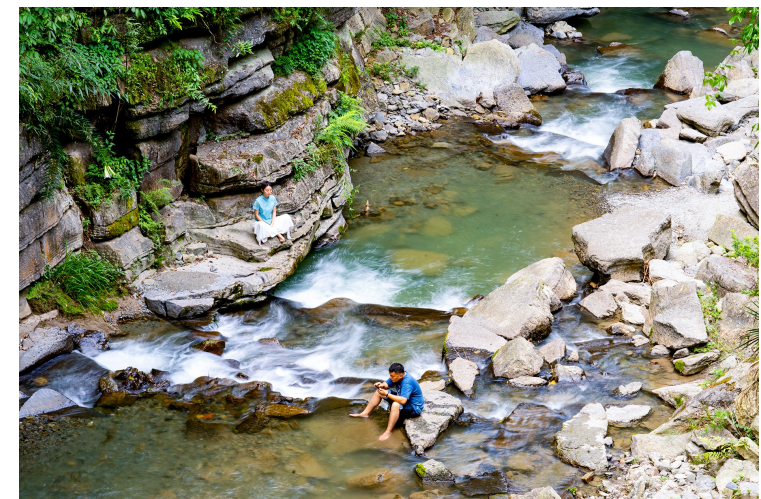
游客在清凉小溪避暑玩水。

路过“178”环线上的大有镇,慢下来,去品尝一碗地道的大有油茶,感受唇齿留香;去山水间露营,与大自然来一次亲密接触;去听听大有人的故事,感受大有镇的别样风情。