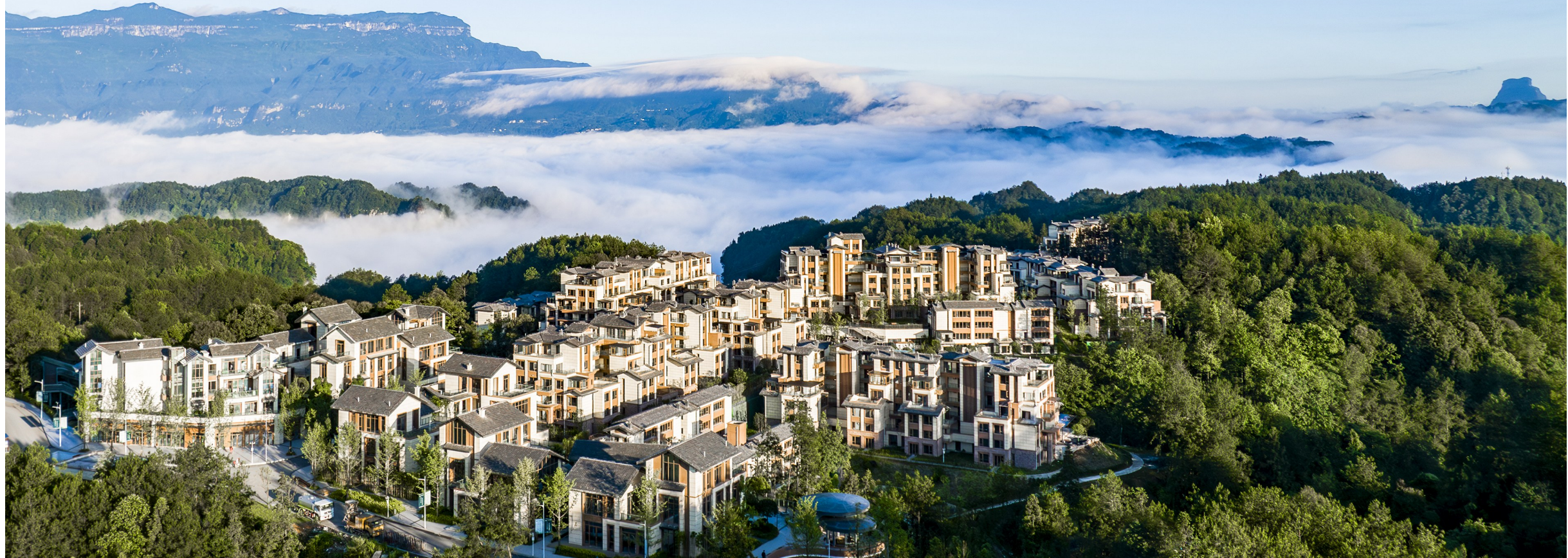
“金佛东麓”康养地产。