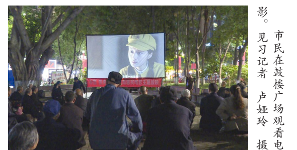
市民在鼓楼广场观看惠民电影。

本报讯（见习记者 卢娅玲）近日，由区委宣传部牵头开展的公益惠民电影放映活动在全区各放映点有序开展中。