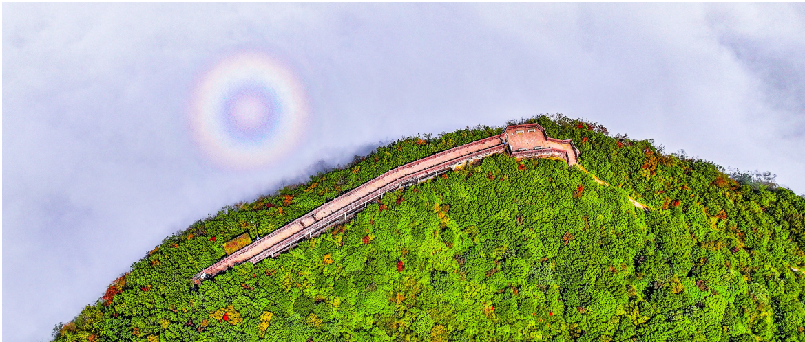
一轮日晕环仿佛张开大眼睛在注视着这座神奇的山。