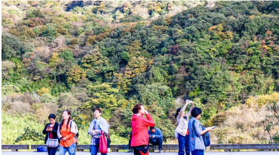
游客在金佛山景区欣赏彩林美景。