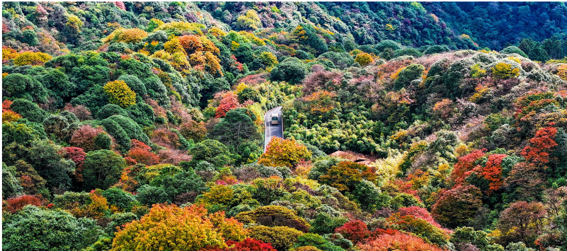
红、黄、绿、粉多色彩林把金佛山装扮得格外亮眼。