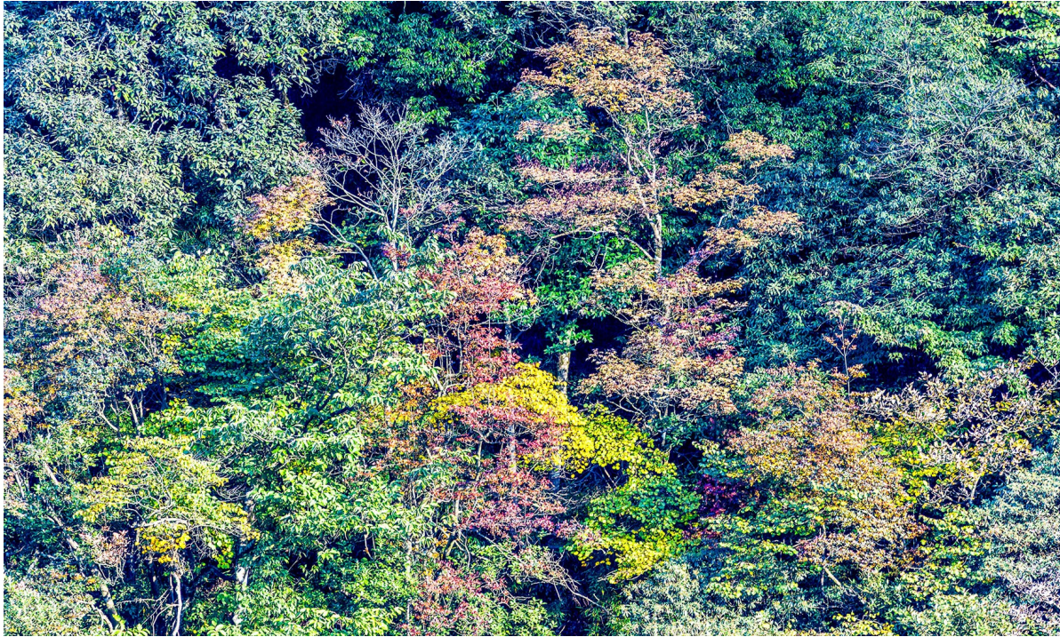
金佛山景区彩林斑斓景美如画。

如果你没来过,一定要来瞧瞧,在这里,你可以感受到大自然的美丽与神奇;可以领略到人与自然和谐相处的美好;可以体验到一种超脱尘世的宁静与安详。