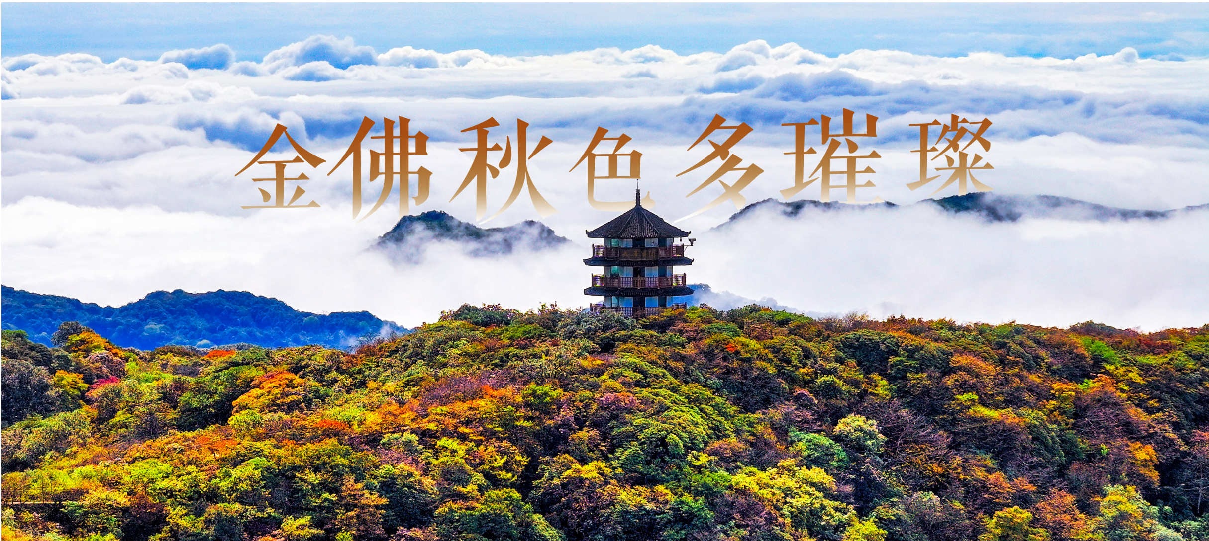
10月14日,金佛山景区出现秋日云海美景,宛如仙境的云海与色彩斑斓的秋林、雄伟壮丽的山峦交相辉映,形成了一幅壮美的生态画卷。