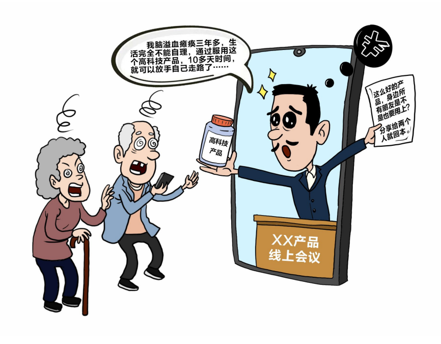
▲漫画 ▲分享者称该产品可治疗癌症。(微信截图)

记者以想要购买相关产品为名,咨询了其他售卖相关产品的人士。对方表示,想要赚钱,必须下单购买产品成为会员,“不存在卖不出去,身边的亚健康人群很多,糖尿病、高血压、肥胖……”记者询问能否先成为会员,挣钱后再扣除购买产品的费用,遭到拒绝。