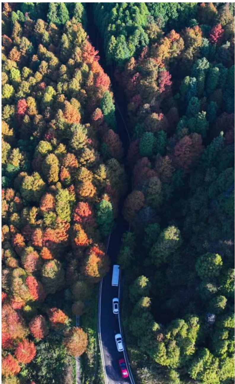
山王坪景区层林尽染,吸引不少游客自驾至此。