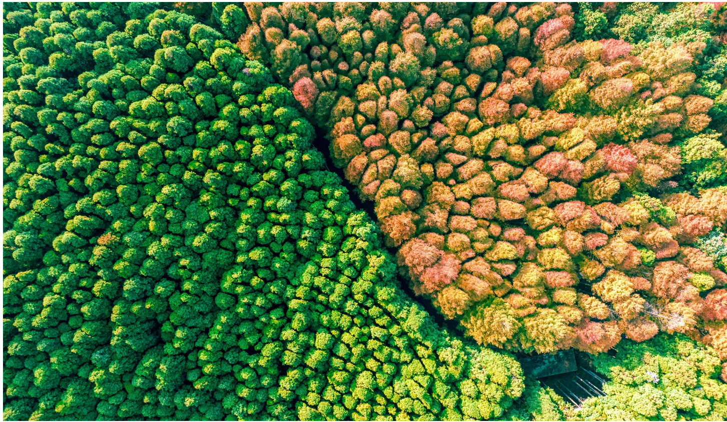
山王坪景区内,两种颜色“泾渭分明”,呈现出「一半是春天,一半是秋天」的美丽景观。

对于喜欢户外活动的人来说,山王坪无疑是一个理想的去处。这里有专门的露营区,可以在这片美丽的自然中搭建帐篷,夜晚仰望星空,融进自然。