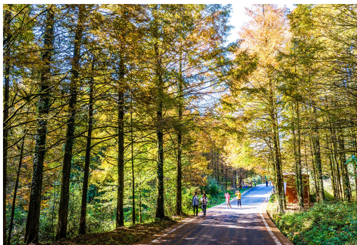
游客在山王坪景区游玩。