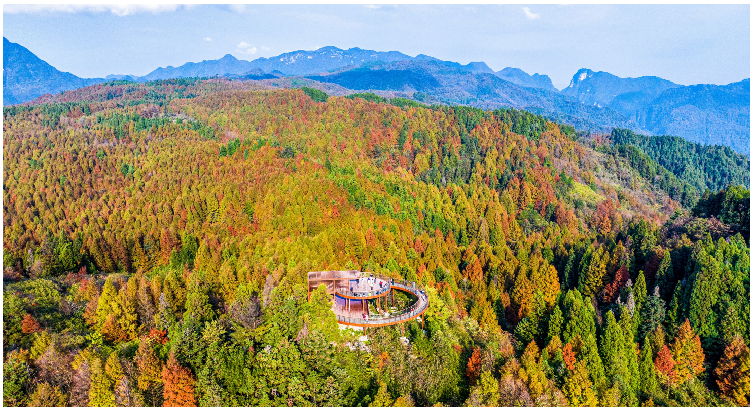
游客在观景平台欣赏美丽秋色。