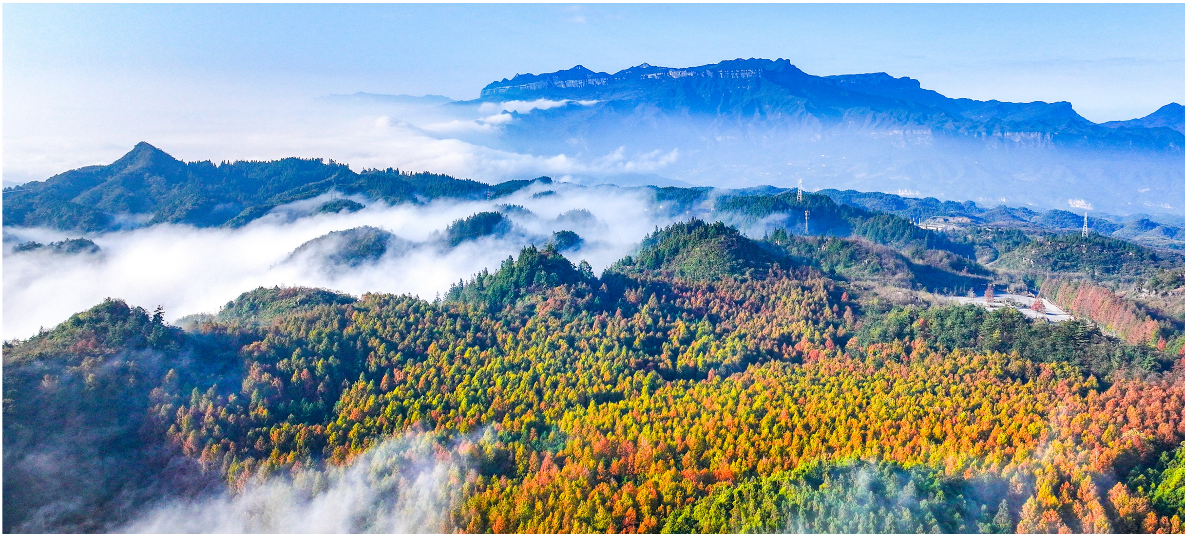
立冬之后,水杉逐渐变黄,与常绿的柳杉平分秋色,从空中俯瞰,漫山遍野多姿多彩。