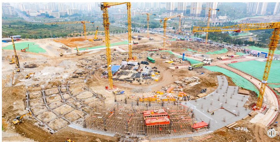
图①:12月2日拍摄的重庆工业职业技术学院南川校区建设现场。