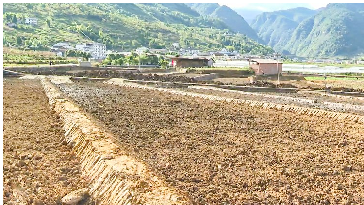
南平镇永安村高标准农田地块。