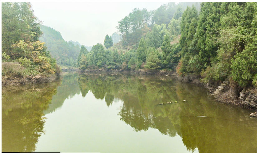
整治后的跃进水库渗漏问题得到解决,已正常蓄水。

本报讯(记者 李崎君)“经过一系列的维修整治,跃进水库现在的蓄水量比以前增加了三分之一,在雨季能轻松蓄满水,有效提升了水厂的生产生活用水。”