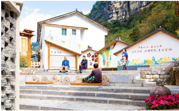
三泉镇观音村乡风文明。

我区在首批国家农业现代化示范区创建中期评审中获全市唯一“好”等次。大观镇（蓝莓）国家农业产业强镇项目通过中期评估。全年完成农业项目储备68个，投资30亿元，联合区发展改革委申报2025年中央预算内项目2个，投资1.84亿元。农业绿色发展取得新成效，农作物病虫害绿色防控覆盖率达56.2%、三大粮食作物病虫害统防统治覆盖率达46.5%、畜禽粪污综合利用率达90.34%。