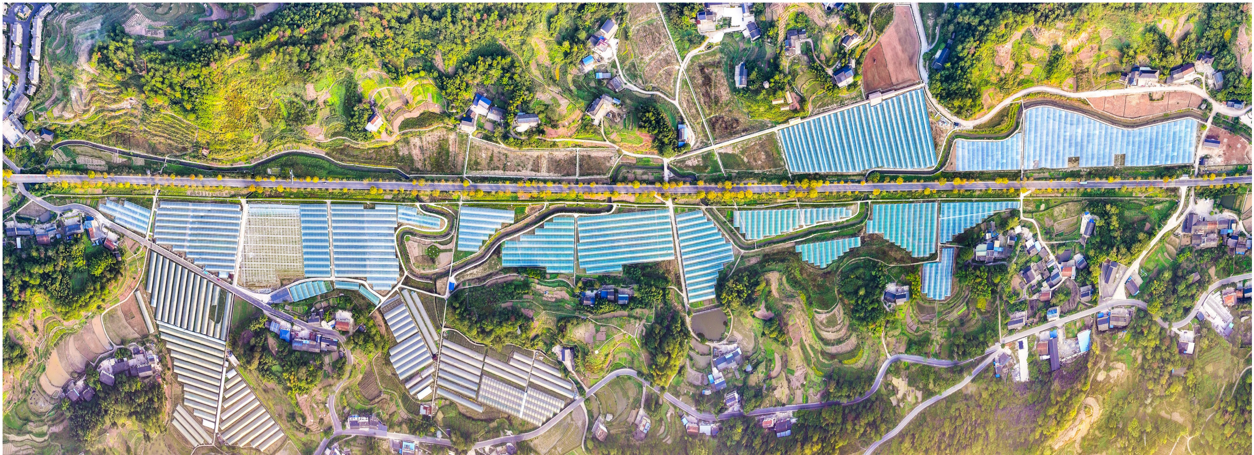
大观镇中江村高标准设施农业基地。