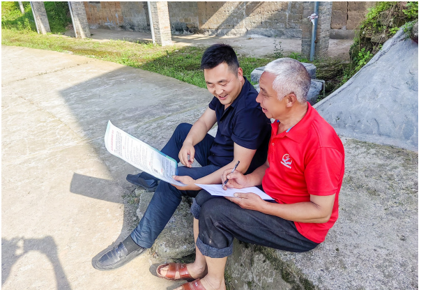
“大走访大排查大整改”行动入户走访宣传政策。

探索多元利益联结机制，优化“集体经济组织+合作社+农户”“企业+合作社+农户”“定制农业”等模式，在设施农业基地建设过程中探索实施“村集体组织经济集中流转土地+政府投资建设+专业化公司运营”建营一体改革模式，58.9%的农户与新型经营主体建立利益联结，带动农民持续稳定增收。全区土地规模经营面积累计51.56万亩，规模经营度达到52.23%。2024年，全区农村产权要素交易额达到1.66亿元、超年度任务的10%。