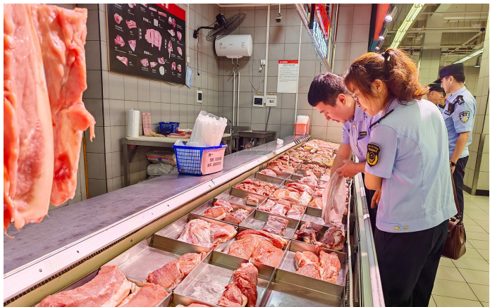
开展肉类产品生产经营单位专项检查。