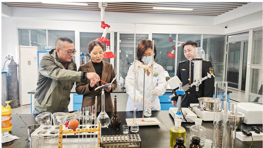
开展首席质量官活动,加强质量人才队伍建设。

保障四大安全,筑牢平安防线。运用“渝食安”“渝药安”“阳光食品”APP等数字平台,健全食品药品安全全链条监管体系。督促企业配齐质量安全员,落实风险管控主体责任;加强对危化品、电动自行车、燃气灶具等重点产品的安全隐患排查;开展燃气调压箱和电梯维保质量专项整治,推进15年以上电梯更新换代。 激发主体活力,优化营商环境。打造“渝悦易企办”服务体系,用好“E企办”和“渝企在线”应用,积极回应经营主体在生产经营过程中的高频需求。严格执行实际市场准入效能评估制度,推动“非禁即入”。持续开展“双随机、一公开”监管。完善信用标准制定,推动“失信惩戒”和信用提升工作“双管齐下”。 推动改革创新,壮大发展势能。深入园区企业推广首席质量官制度,开展质量技术帮扶行动,着力扶优做强一批本地制造企业。依托区知识产权综合服务中心,为市场主体在品牌创建、维权援助等方面提供指导服务;布局一批高价值专利组合,加速形成重点产业领域知识产权竞争新优势。围绕特色优势产业申报发展项目,推进标准化示范试点工作;引导企业延伸服务项目,拓展业务范围,推动检验检测业发展。 加强权益保护,营造放心市场。强化价格监管,严厉打击水电气、医疗、教育等领域违规收费行为;强化消费维权,进一步提高12315、12345平台及其他渠道受理的投诉和举报处理效率,有效遏制损害消费者权益违法行为。强化广告监管,紧盯保健食品、金融、医疗美容等重点领域,从严查处虚假广告;强化网络监管,完善网络交易监管机制。