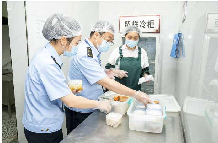
开展校园食堂食品安全检查。