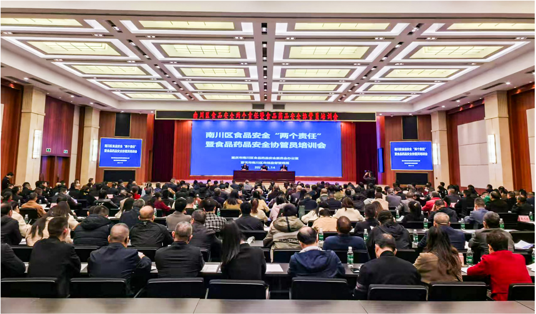
开展食品药品安全协管员培训会。