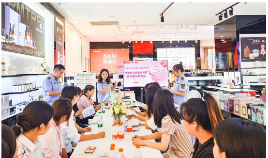
开展药品安全宣传周活动。

构建放心消费环境。发展12315消费维权服务站3家,在线消费纠纷解决单位4家;与区法院签署《加强消费者权益保护合作框架协议》,建立“法院+市场监督管理局+消费者权益保护委员会”消费者权益保护协作联动机制,推动并完善消费者权益保护联动合作工作格局。丰富消费维权宣传载体,开展消费体察活动2次,发布消费警示提示7期,曝光典型案例1例。2024年共处理消费投诉举报2624件,按时办结率达100%,为消费者挽回经济损失56万元。 扎实开展群众身边不正之风和腐败问题集中整治行动。开展校园食品安全排查整治专项行动,整改隐患248个。对全区电动自行车销售单位实行统一建档,督促销售单位做到信息统一公示、销售统一分类分区;建立月调度、信用评价、社区共治三项机制,从严检查电动自行车销售单位329家次。开展医疗领域欺诈骗保专项整治,查处案件2起。 切实维护市场秩序。聚焦民生领域价格收费,对全区8家燃气经营企业开展专项检查。开展违法违规广告治理,清理虚假广告20余条。推动平台经济有序发展,排查网络交易经营主体1299家,查处涉网违法案件17件,有效净化我区网络市场环境。 着力提升执法效能。严格落实行政执法“三项制度”,有效处理法与情的关系,严格落实《重庆市市场监管领域轻微违法行为不予处罚清单》87项免于处罚事项,推行“柔性执法、首违不罚”,对30件轻微违法案件免于行政处罚。开展“铁拳”行动,依法严厉打击农村假冒伪劣食品、侵犯知识产权、加油机计量作弊等违法行为,2024年办结各类违法案件363件。