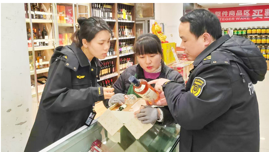
开展食品流通专项检查。