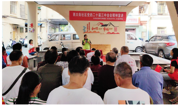
开展新时代文明实践活动。

工作机制，深化重点项目“首席服务官”制度，从土地流转、征地拆迁、纠纷协调、要素保障等方面提供全生命周期服务，协调解决43个市区重点项目重点事项500件，保障渝厦高铁、重庆工业职业技术学院南川校区等43个区级以上重点项目稳妥推进，多措并举促进经济高质量发展。