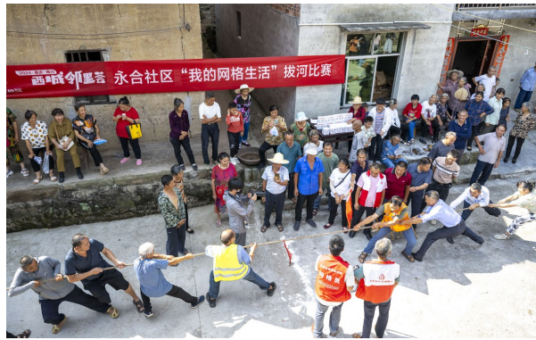
举行拔河比赛促进邻里和谐。

带动村（社区）集体经济收入平均达60万元，脱贫攻坚成果持续有力巩固。落实“五个到位”，统筹推进大气污染防治、耕地粮食保护、河长制、林长制、路长制等工作，美丽南川建设西城行动见行见效。