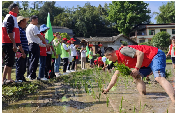
组织志愿者在春播春耕时节帮助村民栽秧。

伍管执法”机制，有序承接93项行政执法事项，升级“1+12”“街道一村（社区）综治（矛调）中心建设，推进村（社区）警务室全覆盖建成投用，新建“格小西”工作室“法律之家”11个，培育聚合“金佛山社工中心”“五老”“西大姐”“格小西”工作室力量，逐步构建最先发现、最快处理违法行为的基层行政执法体制。