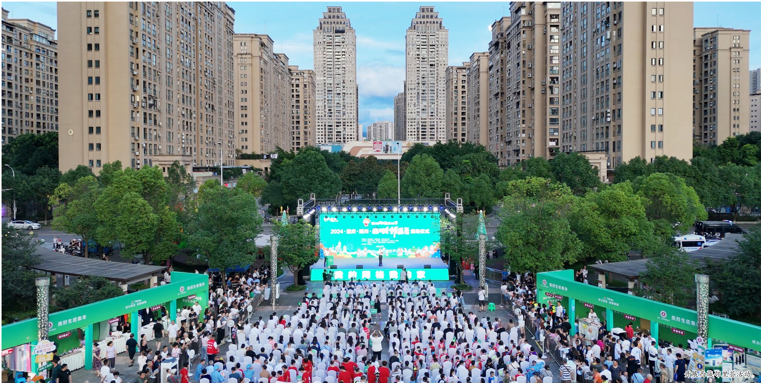
开展西城邻里茶活动。