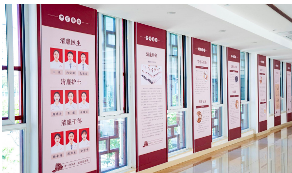
深化清廉医院建设成效。