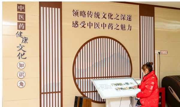
市民在中医药健康文化知识角了解中药煎煮。