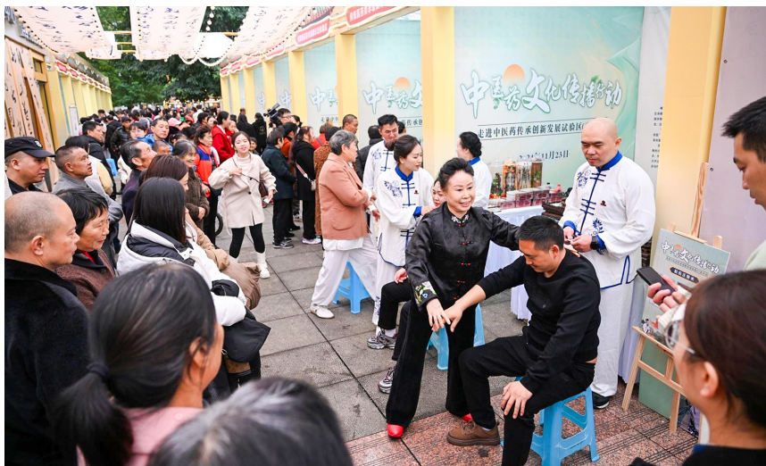
2024年中医药文化传播行动·走进中医药传承创新发展试验区（重庆站）活动。