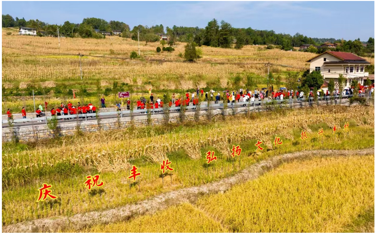
举办“中国农民丰收节”活动。

卫星社区的蔬菜、高粱、中药材种植业，大米加工业；盐井村的优质水稻种植业、乡村旅游业；五星村的养殖业、家禽加工业；南茶村的有机蔬菜、茶叶种植业，泡菜加工业；翠丰村的高粱白酒酿造业；石庄村的南美白对虾养殖业……村村有思路、村村有产业、村村有特色，通过建立集体经济发展新格局，石溪镇正徐徐打开乡村振兴的亮丽蓝图。