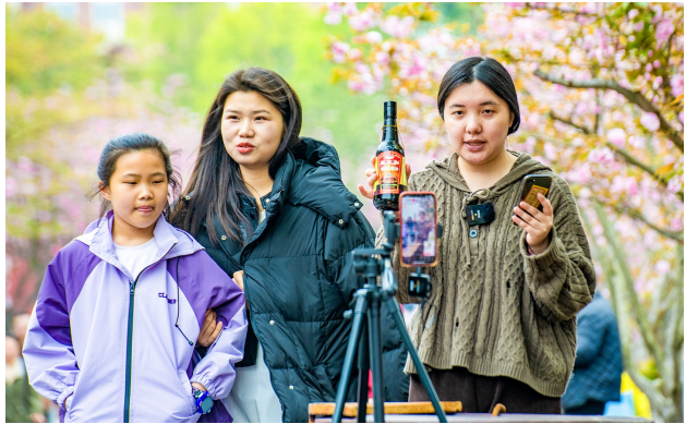
▲网络主播在樱花树下直播售卖当地特产。