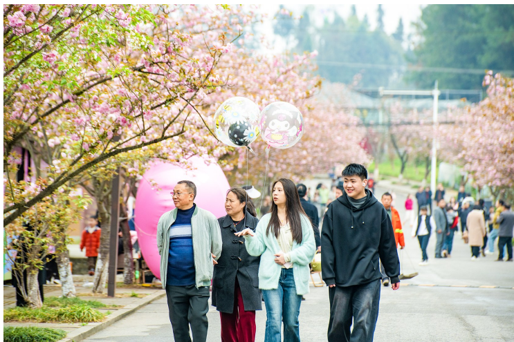
▲游客行走在樱花大道，一同见证春日浪漫。