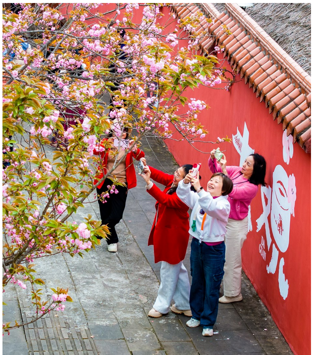
▲静美的樱花惹得游客纷纷来此打卡拍照。