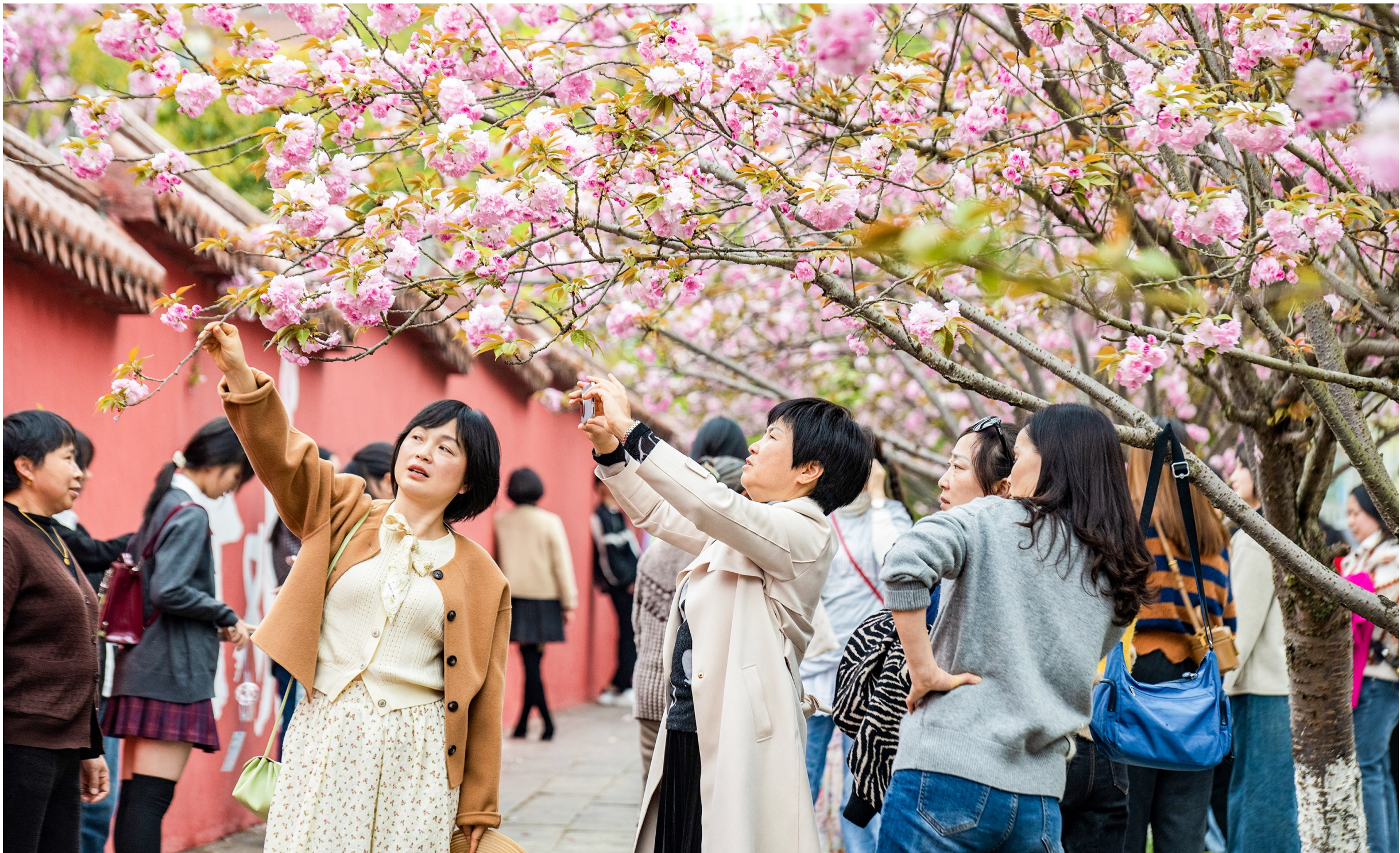
▲游客在樱花、红墙间拍照留念，定格春日美景。