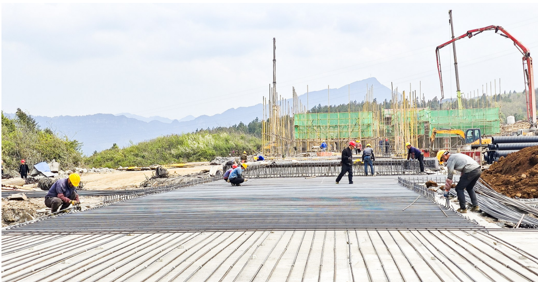
花好月圆项目建设现场,工人在加紧施工。