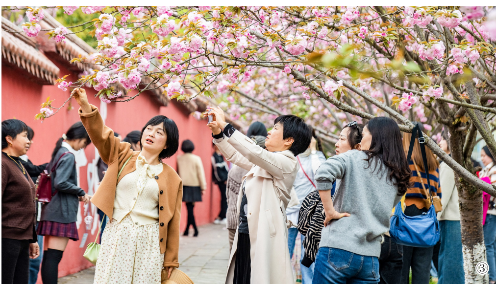
图①:冰雪季期间,游客在金佛山滑雪场滑雪。(资料图片)