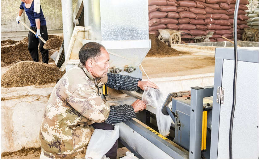
工人用机械设备制作菌包。