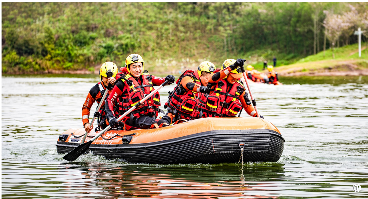
图①：参训队员协作驾驶舟艇。 图②：参训队员开展舟艇水面编队训练。 图③：参训队员在模拟水域救援。