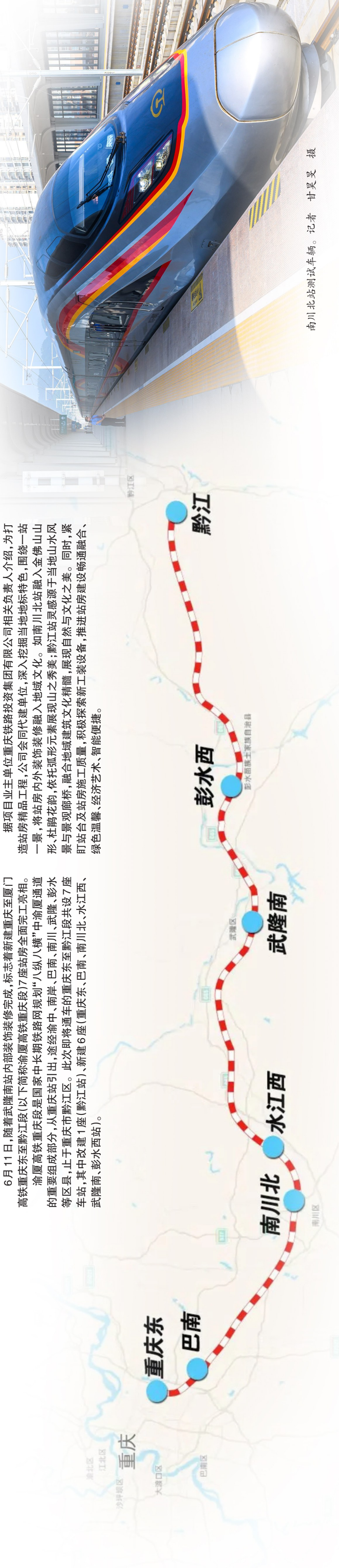
南川北站测试车辆。

据项目业主单位重庆铁路投资集团有限公司相关负责人介绍，为打造站房精品工程，公司会同代建单位，深入挖掘当地地标特色，围绕一站一景，将站房内外装饰装修融入地域文化。如南川北站融入金佛山山形、杜鹃花韵，依托弧形元素展现山之秀美；黔江站灵感源于当地山水风景与景观廊桥，融合地域建筑文化精髓，展现自然与文化之美。同时，紧盯站台及站房施工质量，积极探索新工装设备，推进站房建设畅通融合、绿色温馨、经济艺术、智能便捷。