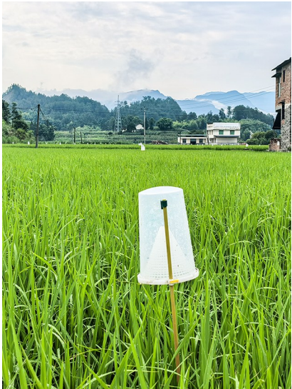
▲稻田里的“白色卫士”——水稻病虫害诱捕器。 ►一道道白色防控风景线。

本报讯(见习记者 卢娅玲)近日,区农业农村委在大观镇、兴隆镇、福寿镇等水稻产区大力推广病虫害绿色防控技术。