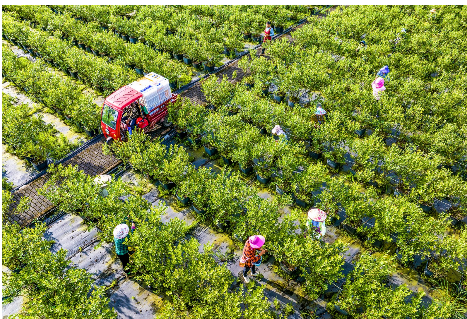
5月25日,大观镇标准化蓝莓种植基地,果农趁晴好天气采收蓝莓。