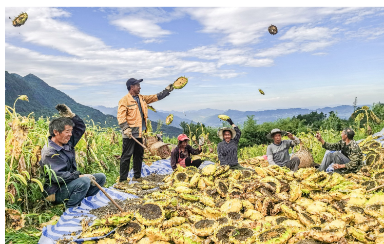
8月25日,水江乐村蔡家坪高山葵花基地,村民忙着采收葵花籽。