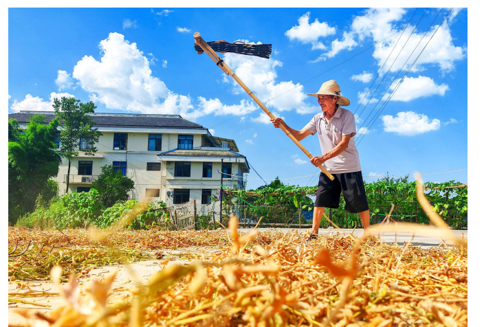
8月12日,木凉镇玉岩铺村村民用传统方式脱粒黄豆。