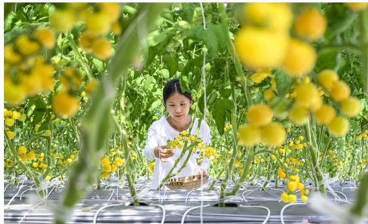
6月10日,滕春蔬菜种植智慧工厂,游客在采摘番茄。