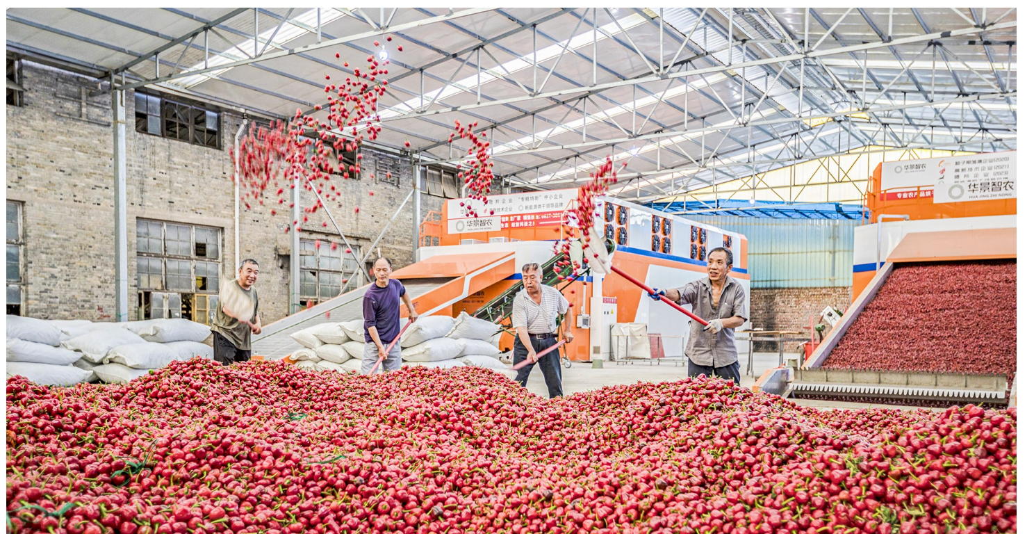
7月22日,南川区银盘金梭蔬菜专业合作社,工人在工厂烘干成熟的“草莓椒”。