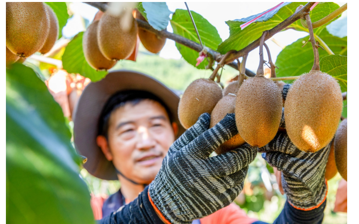
9月7日,大观镇铁桥村猕猴桃基地,颗颗饱满的猕猴桃果香四溢。