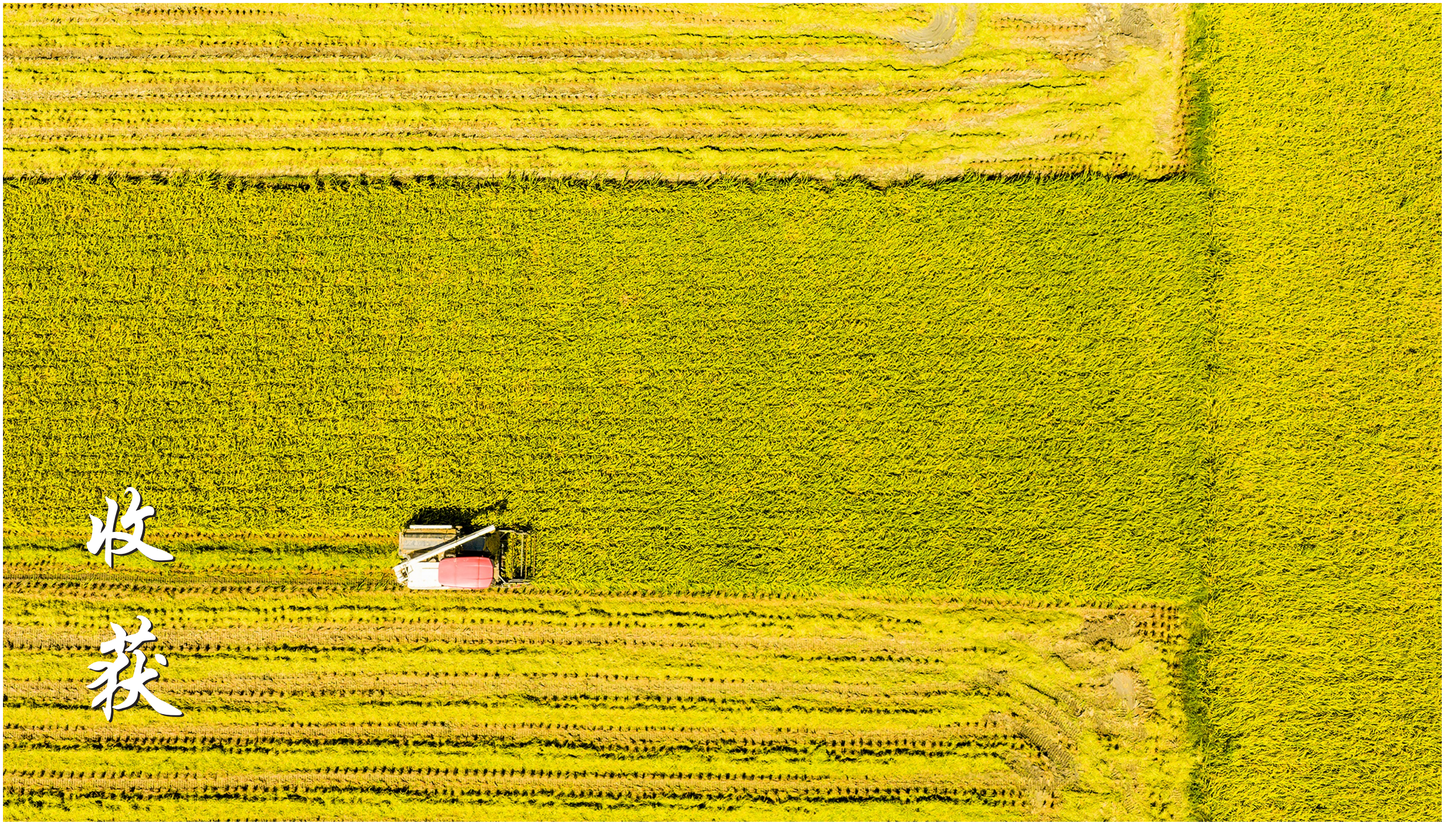
8月19日,东城街道三秀社区,收割机在稻田收割水稻。