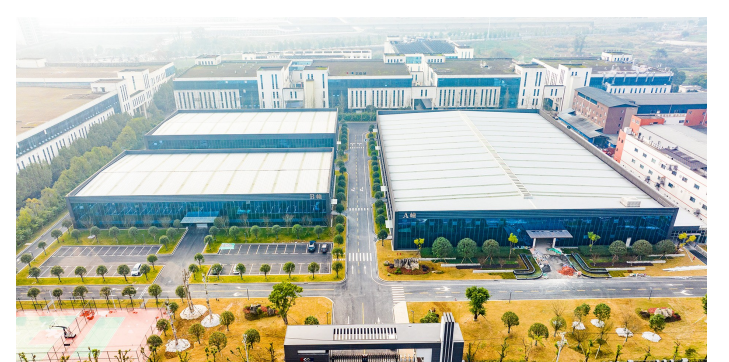
重庆嘉格纳实业有限公司。