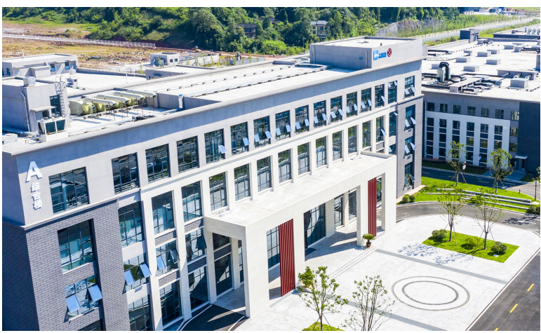
重庆上药慧远药业有限公司。