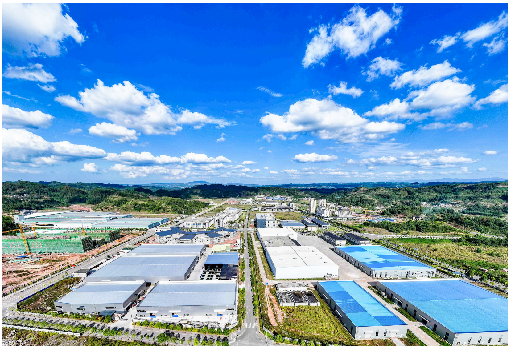
中医药科技产业园。