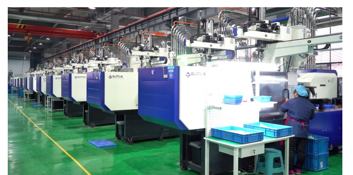
凯乐玩具文创产品自动化生产线。

提升园区服务效能。推进“审批不出园”改革，完善企业服务专员机制，破解用地、融资、用工难题。完成化工园区扩区筹建复核获批。搭建政银企平台，降低融资成本，强化要素保障，优化“园区事园区办”服务环境。