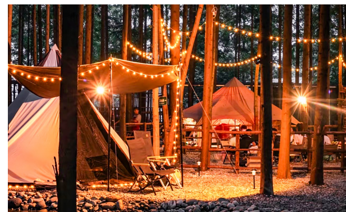
枫香崖森林露营地。

更可喜的是，村集体经济的“家底”愈发厚实。通过向上争取资金、盘活资源、创新“入股联营”等模式，全镇6个村集体经济总收入达到608万元，同比增长96%。同时，通过向上争取资金240万元，推进洪湖村茶野山居民宿、隆兴村茶业配套、银杏村中药材加工、马鞍村茶业加工厂等项目建设。