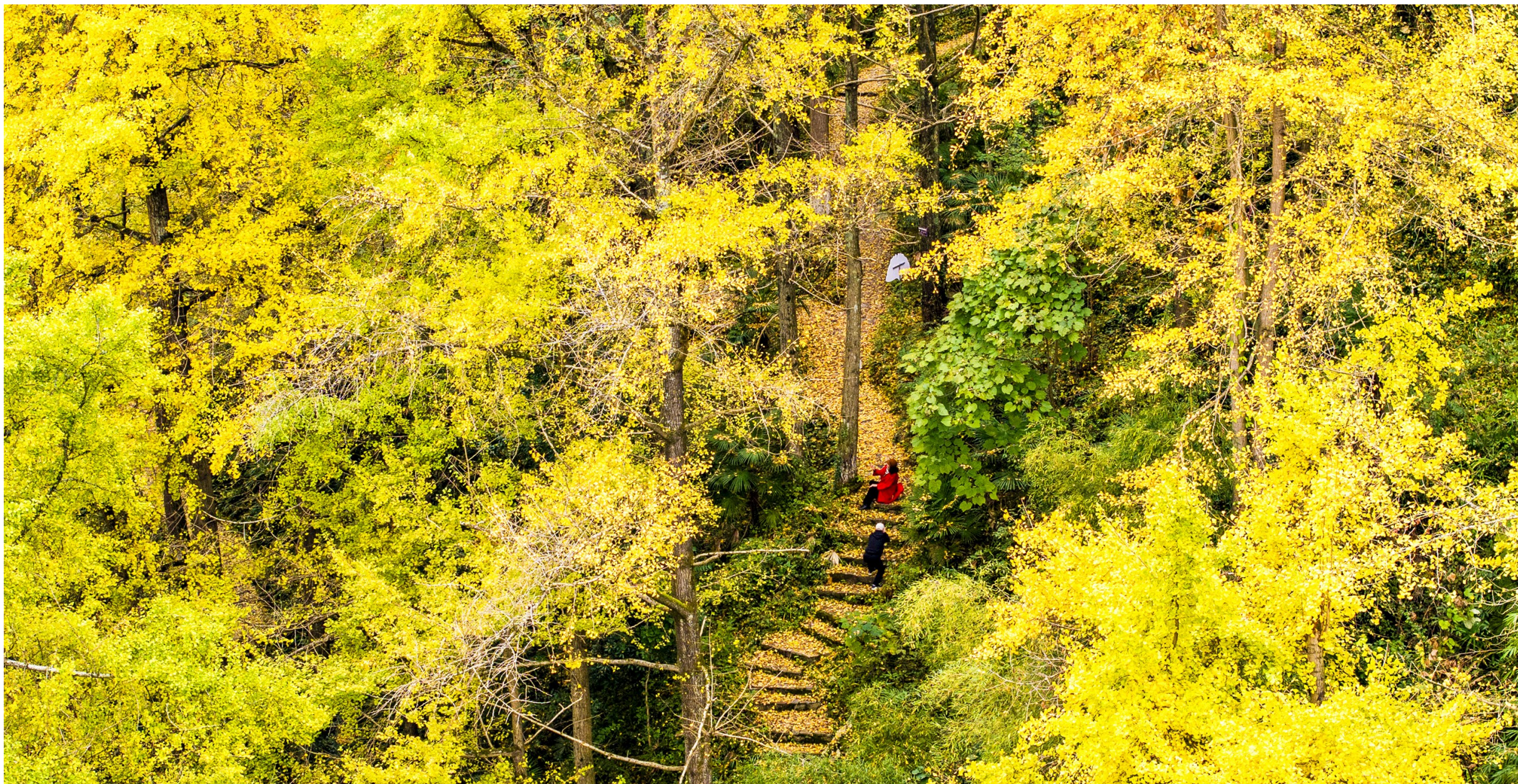
银杏村古银杏群。

回望2025年，一幅来自德隆镇的发展画卷徐徐展开：古银杏树下游人留下的欢笑声，大树茶园里茶农收获的喜悦，露营基地夜晚升腾的篝火，新修公路串联起的希望田野……在“十四五”收官之年，德隆镇交出了一份沉甸甸的成绩单：农村居民人均可支配收入2.42万元，村集体经济总收入猛增96%，全年接待游客超35万人次……这一连串亮眼数据的背后，是德隆镇紧扣“生态原乡·绿色德隆”发展定位，坚持农文旅融合与大树茶特色产业“双轮驱动”，奋力书写中国式现代化乡镇实践的崭新图景。