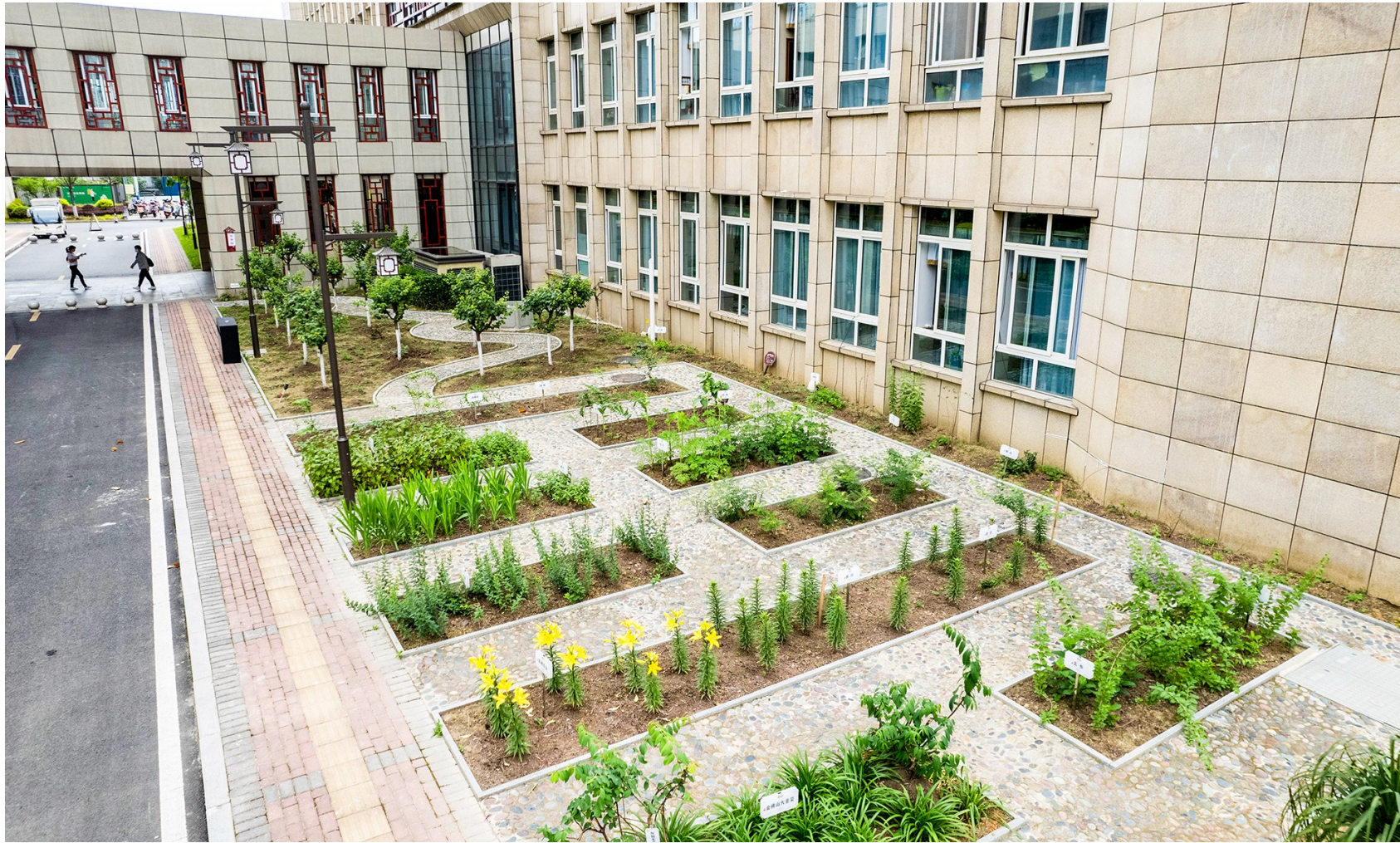
区中医医院种植的百草园。

2025年,重庆市南川区中医医院,以创建国家三级甲等中医医院为牵引,以发挥中医药特色优势为核心,书写了一篇医疗、教学、科研、管理、服务协同并进的高质量发展生动篇章。 这一年,区中医医院门急诊服务量45.1万人次,同比增长19.37%;住院服务量2.6万人次,同比增长3.09%,患者满意度保持98%以上;一系列国家级项目在此扎根结果,为南川区国家中医药传承创新发展试验区建设注入强劲动力。