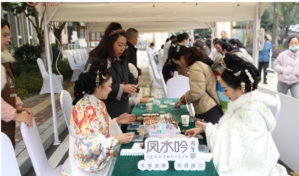
第六届膏方文化节活动现场。