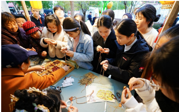
市民体验中医药文创产品。