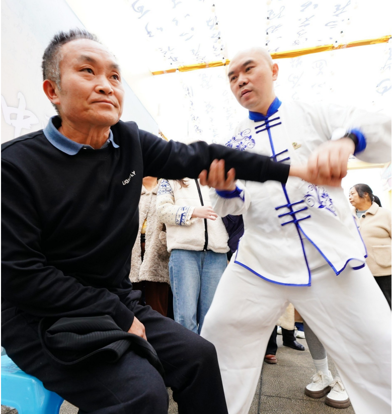
市民体验非遗技术。

文化惠民活动暨“渝见岐黄”重庆中医药文化集市巡回服务,通过央视频、重庆国际新闻中心“把重庆讲给世界听”直播,吸引了超351万人次观看,将巴渝中医药文化的魅力传播到海内外。“小小中医师”“悦读中医”等30余场沉浸式体验活动,“中医中药进万家”近百场惠民活动,让中医药文化深入人心。 文化是医院的灵魂。以建院50周年为契机,医院举办纪念大会,编纂出版科普图书《金山本草润童心》,稳步推进《院志》编撰,提质升级百草园……医院正在系统构建具有自身特色的中医药文化体系,让历史底蕴与现代发展相得益彰。 五十载悬壶济世,半世纪春华秋实。如今的南川区中医医院,正承载着历史的荣光与时代的使命,以更加坚定的文化自信、更加昂扬的奋斗姿态,在传承发展中医药事业、护航人民生命健康的伟大征程上,奋楫扬帆,破浪前行,奋力谱写更加辉煌的金山岐黄新篇章!